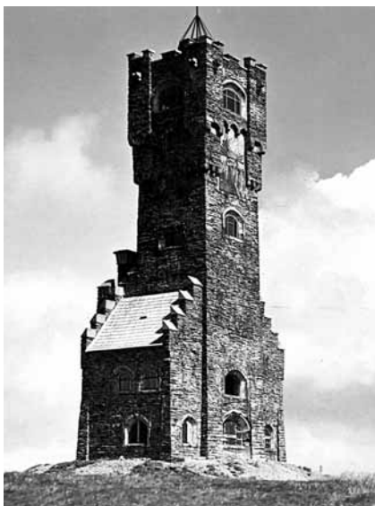
Wieża widokowa na Pradziadzie

Otwarcie odbyło się 9 IX 1934 r. W przeddzień 8 IX 1934 r. o 20.00 budowla została oświetlona. O 21.00 odbyło się uroczyste posiedzenie przedstawicieli sekcji i zaprzyjaźnionych towarzystw górskich w Ovčárni. 9 IX o 9.00 uroczystości z udziałem ponad 12 000 osób zainaugurowały fanfary z platformy wieży. O 10.00 rozpoczęła się msza święta, którą odprawił wielki mistrz zakonu krzyżackiego Paul Heider, a po niej nastąpiło otwarcie hali pamięci. Popołudniu odbył się koncert i uczestnicy mogli zwiedzić wieżę płacąc 2 kc. MSSGV zorganizowało komunikację omnibusową, tak by uczestnicy mogli bez trudu dotrzeć na mszę 63 .