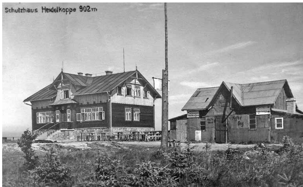
Schronisko na Borówkowej (po lewej) wraz z budynkiem gospodarczym