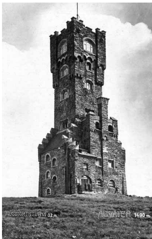
Wieża widokowa na Pradziadzie

Cały czas gromadzono pieniądze i starano się uzyskać