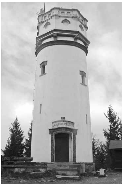
Wieża widokowa na Biskupiej Kopie