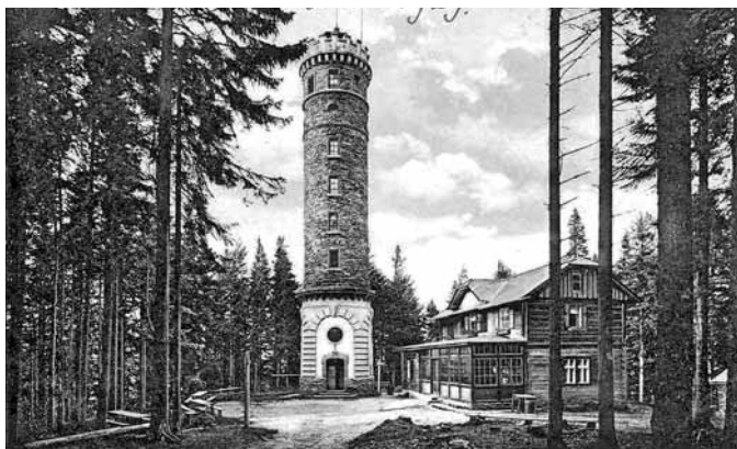
Wieża widokowa i schronisko Medritzera na Zlatým Chlumie

ło budowę SSGV z Nysy, Dobudowano wówczas piętro, szklany przedsi- sionek, a w pokoju gościnnym, który służył biskupim leśnikom, dodano 2 okna. W schronisku istniała też sala klubowa sekcji Jeseník. Otwarcie nastąpiło 19 VI 1926 r. Z powodu złej pogody frekwencja była marna 46 .