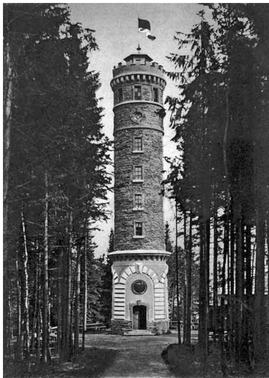
Wieża widokowa na Złatym Chłumie

Obok wieży stanęło wkrótce schronisko im. Medritzera. Sama wieża okazała się bardzo dobrą inwestycją. Została bardzo solidnie wykonana dzięki czemu miała w przyszłości przetrwać krótsze lub dłuższe okresy zaniedbania. Jedyną częścią budowli, która nie była dobrze wykonana były blanki. Już w 1905 r. były uszkodzone i przeprowadzono ich remont. Początkowo zarząd sekcji Jesenik chciał je pokryć blachą i na niej zaznaczyć kierunki obiektów, które są widoczne. Walne zebranie odrzuciło jednak ten pomysł i po długiej debacie zobowiązało zarząd do rekonstrukcji zwieńczenia, aby wieża nie utraciła swego piękna 38 .