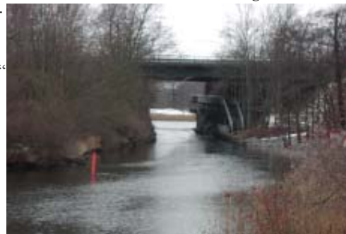
Ålkistan. Kanalen invigdes 1865 Foto Lars Farago i december 2004.

Jag tänkte att hållplatsen skulle hetat Ålkistan, men det blev vaga "Södra