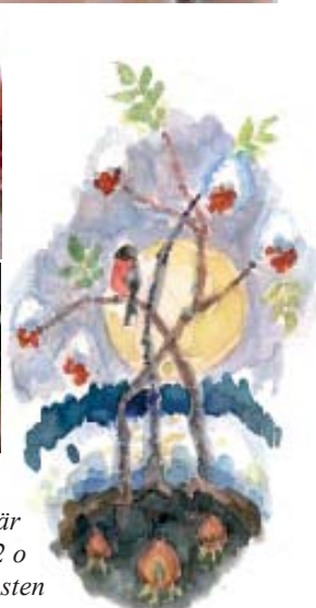
Julillustrationer här och på sidorna 1, 2 o 13: Liselotte Malmsten