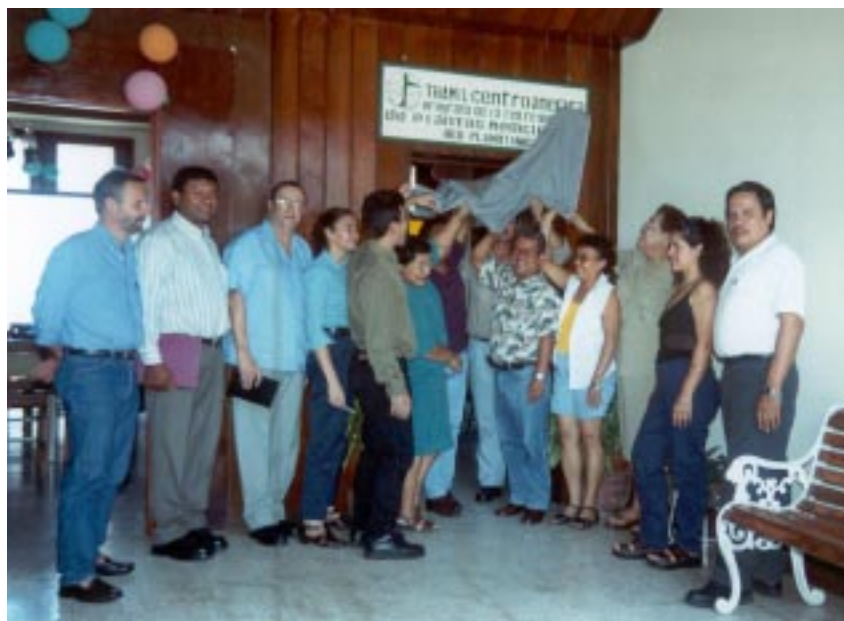
Develización de rotulo de Oficina TRAMIL-Centroamérica y RED PLAMOTANIC. Edificio del AÑO COMÚN, UNAN-León, 14 de junio de 2001.

A partir de abril de 2001 la Oficina de Coordinación TRAMIL-Centroamérica se encuentra en las instalaciones del AÑO COMÚN de la Universidad Nacional Autónoma de Nicaragua – León (UNAN-León). Con el traslado de esta Oficina se instala en el mismo edificio la Oficina sede de la Red Nicaragüense de Sistemas Tradicionales de Salud con Plantas Medicinales y Otras Terapias Alternativas (RED PLAMOTANIC). El 14 de junio del presente se realizó la reinauguración de Oficina TRAMIL-Centroamérica / UNAN-León y apertura de Oficina de Sede RED PLAMOTANIC. Desde aquí se continúan realizando las actividades monitoreo y difusión. Con el estrecho vínculo y cercanía de ambas Oficinas, ha sido posible poner en corto tiempo en la Internet, la apertura de la primera página WEB de la RED PLAMOTANIC. Describiéndose el nacimiento y los objetivos que se persiguen, publicación de boletín electrónico, membresía de la red, etc. La página en mención puede ser visitada en: http://www.ibw.com.ni/u/planmed