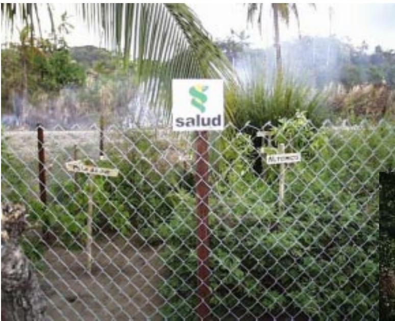
Jardín en el Centro de Salud de Miramar, Panamá.