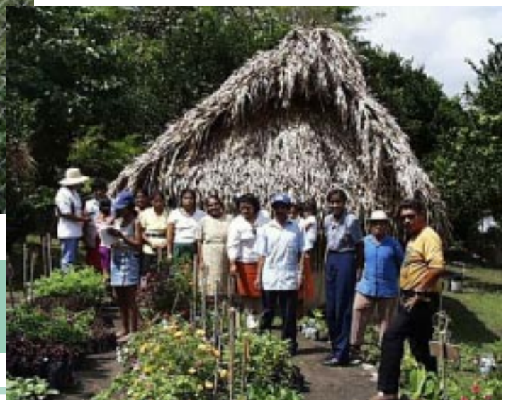
Jardín medicinal de la región de Coclé, Panamá. Tanto el Jardín de Miramar como el Coclé, son atendidos por los Ingenieros agronomos del Ministerio de Salud de Panamá, bajo el convenio con el Programa TRAMIL-Centroamérica.