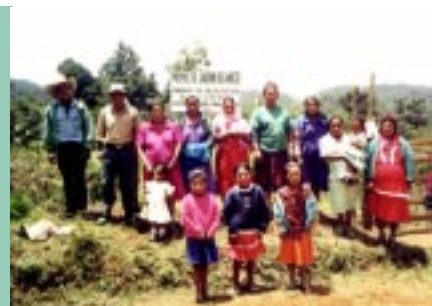
Pobladores de Santa Cruz de Pazguare, Guajiquiro La Paz, Honduras, en el huerto medicinal

Durante los meses de marzo a mayo 2001, haciendo uso de la técnica de agricultura orgánica, el CIMN-H TRAMIL brindó capacitación y apoyo técnico sobre cultivo, cosecha y recolección de plantas medicinales a los beneficiarios del proyecto. Participaron 22 personas de las comunidades de Santa Cruz de Pazguare y Tamara del Municipio de Guajiquiro. Con la participación de 15 pobladores entre hombres y mujeres, se hizo la instalación de un jardín de 7,500 varas cuadradas, compra de herramientas, material de cerco y riego. Para el cuidado de este nuevo jardín se eligió un comité de seis integrantes que dan monitoreo y mantenimiento. Las plantas sembradas fueron: Artemisia ludoviciana , Zingiber officinale , Achillea millefolium , Ruta chalepensis , Chenopodium ambrosioides , Tanacetum parthenium , Eupatorium daleoides , Polipodium aureum , Verbena litoralis , Petiveria alliacea , Sambucus mexicana y Cymbopogon citratus .