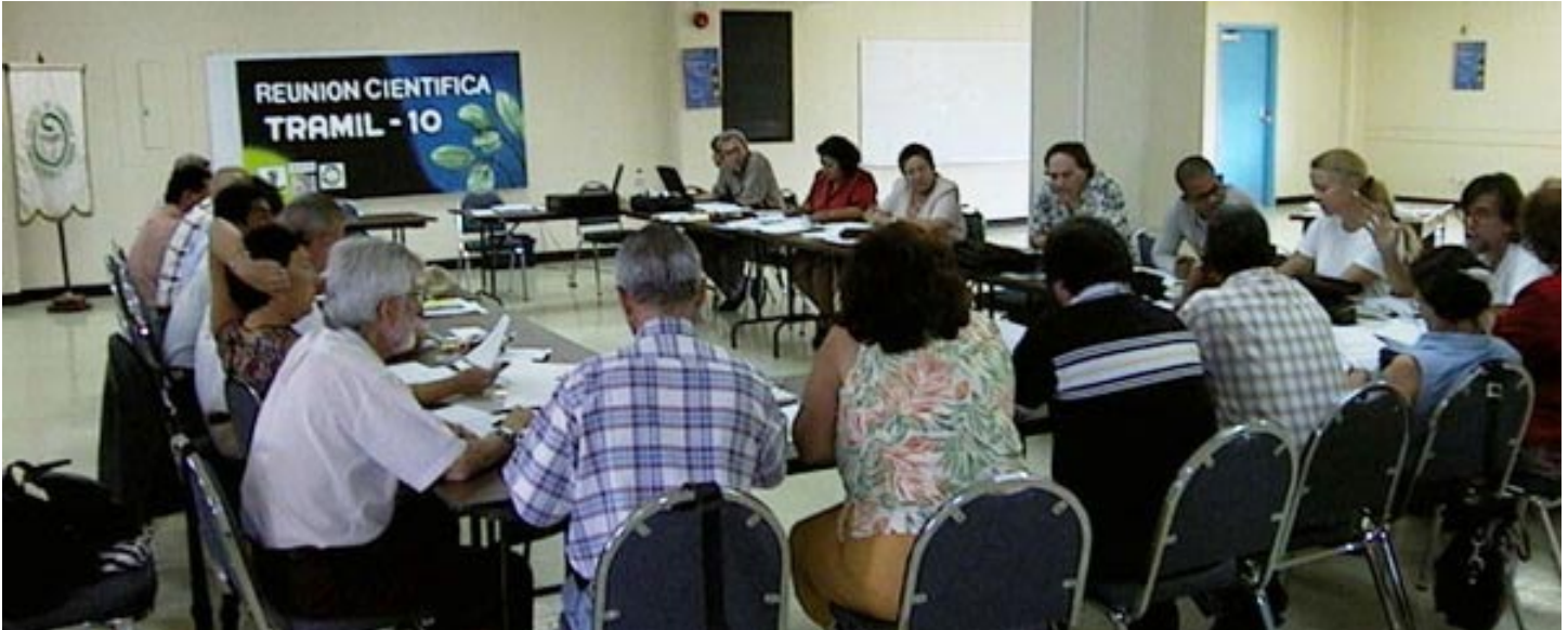
Reunión Científica TRAMIL. Ciudad de Saber, Panamá. Marzo 2001.

En el marco de la reunión técnica denominada Reunión Científica TRAMIL X realizada del 05 al 09 de marzo de 2001 en Ciudad del Saber, Panamá, se desarrolló los días 08 y 09 la revisión y análisis del proceso operativo del Programa TRAMIL, en donde se redefinió la Visión y Misión del Programa TRAMIL.