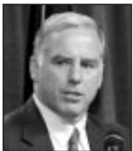
Howard Dean, M.D.