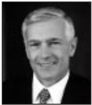
Gen. Wesley K.