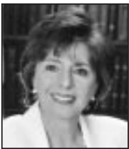
Barbara Boxer 職業： 美國參議員 年齡：63 住在： 加州 Greenbrae

我擔任美國參議員十一年以來，努力保護加州的家庭、就業和環境。我引以為榮的是獲得來自勞工、企業領袖、護士、消防員、退役軍人和老師的廣泛支持。