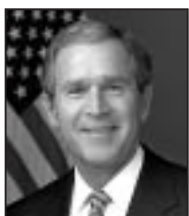
George W. Bush