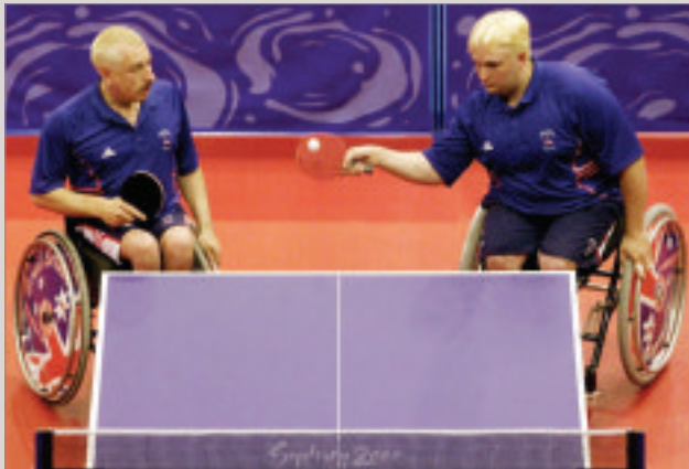
Un Comité d'organisation intégré pour les Jeux Olympiques et Paralympiques - le meilleur du travail d'équipe.

An integrated Organising Committee for the Olympic and Paralympic Games - teamwork at its best.