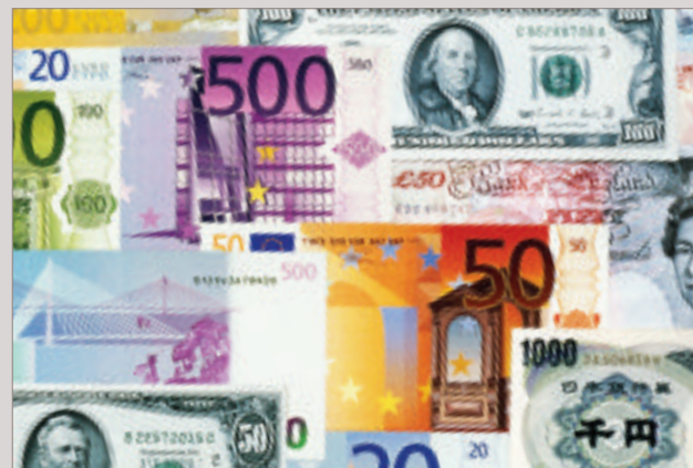
Londres est le principal marché de devises du monde.

The modern skyscrapers of Canary Wharf in east London.