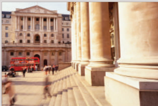
La Banque d'Angleterre a emménagé sur son site actuel de Threadneedle Street en 1734.

The Bank of England moved to its current site in Threadneedle Street in 1734.