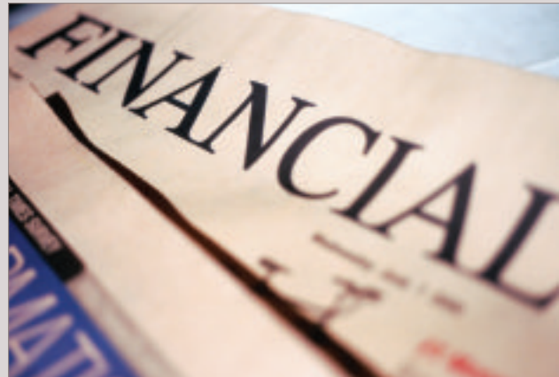
Les pages roses, image de marque du Financial Times .