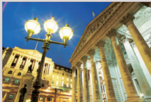
Le Royal Exchange, fondé en 1565, est situé à côté de la Banque d'Angleterre.

The striking architecture of Lloyd's of London, the world's leading insurance market.