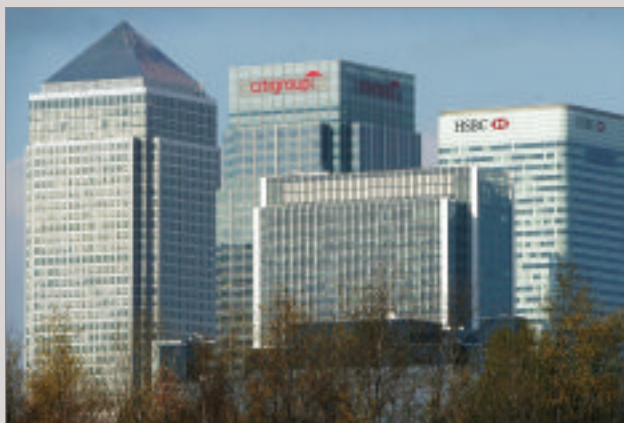
Les gratte-ciels de Canary Wharf dans l'Est de Londres.

The modern skyscrapers of Canary Wharf in east London.