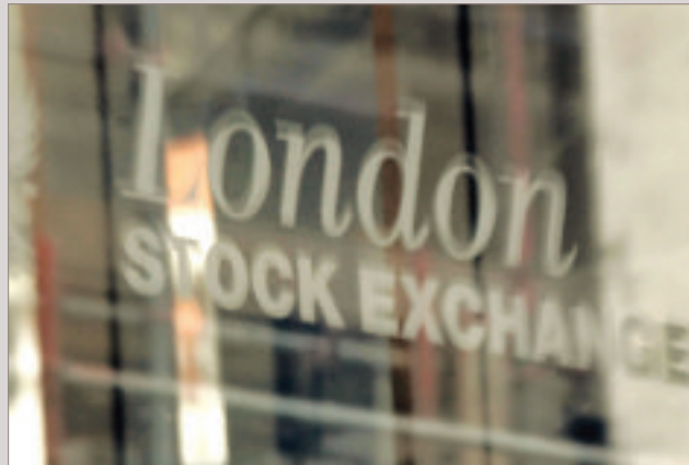
La Bourse de Londres est une des principales bourses du monde.

The skyline of Canary Wharf in east London. An area regenerated from former docks to a rapidly expanding financial and business centre.