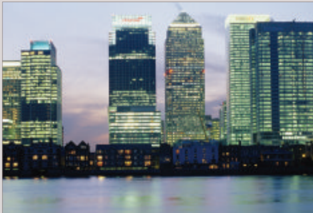
Canary Wharf dans l'Est de Londres, une zone régénérée à partir d'anciens bassins du port et maintenant un centre financier et commercial en expansion rapide.

The skyline of Canary Wharf in east London. An area regenerated from former docks to a rapidly expanding financial and business centre.