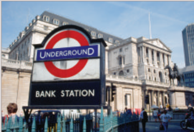
Fondée en 1694, la Banque d'Angleterre est une des principales institutions financières de Londres.