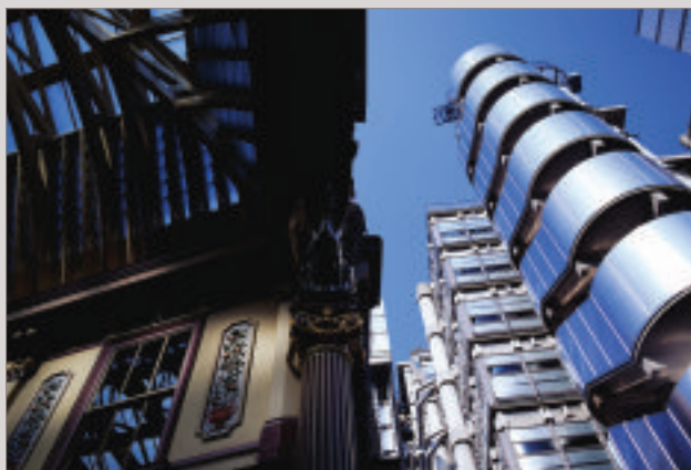
L'architecture remarquable de Lloyd's of London, centre mondial de l'assurance.

The striking architecture of Lloyd's of London, the world's leading insurance market.