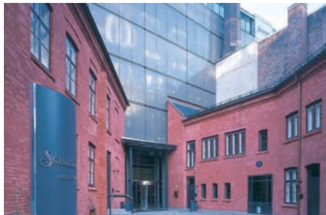
Schibstedin pääkonttori Oslossa. Schibstedin osakkeet on noteerattu Oslon arvopaperipörssissä vuodesta 1992.

Norjalainen Schibsted on kasvanut perheyriyksestä pörssinoteeratuksi mediakonserniksi. Yhtiö toimii kymmenessä maassa ja haluaa yhdistellä eri media-kanavia, mutta painottaa kuitenkin paikallisiin oloihin mukautettua sisältöä ja toimitustyön vapautta.