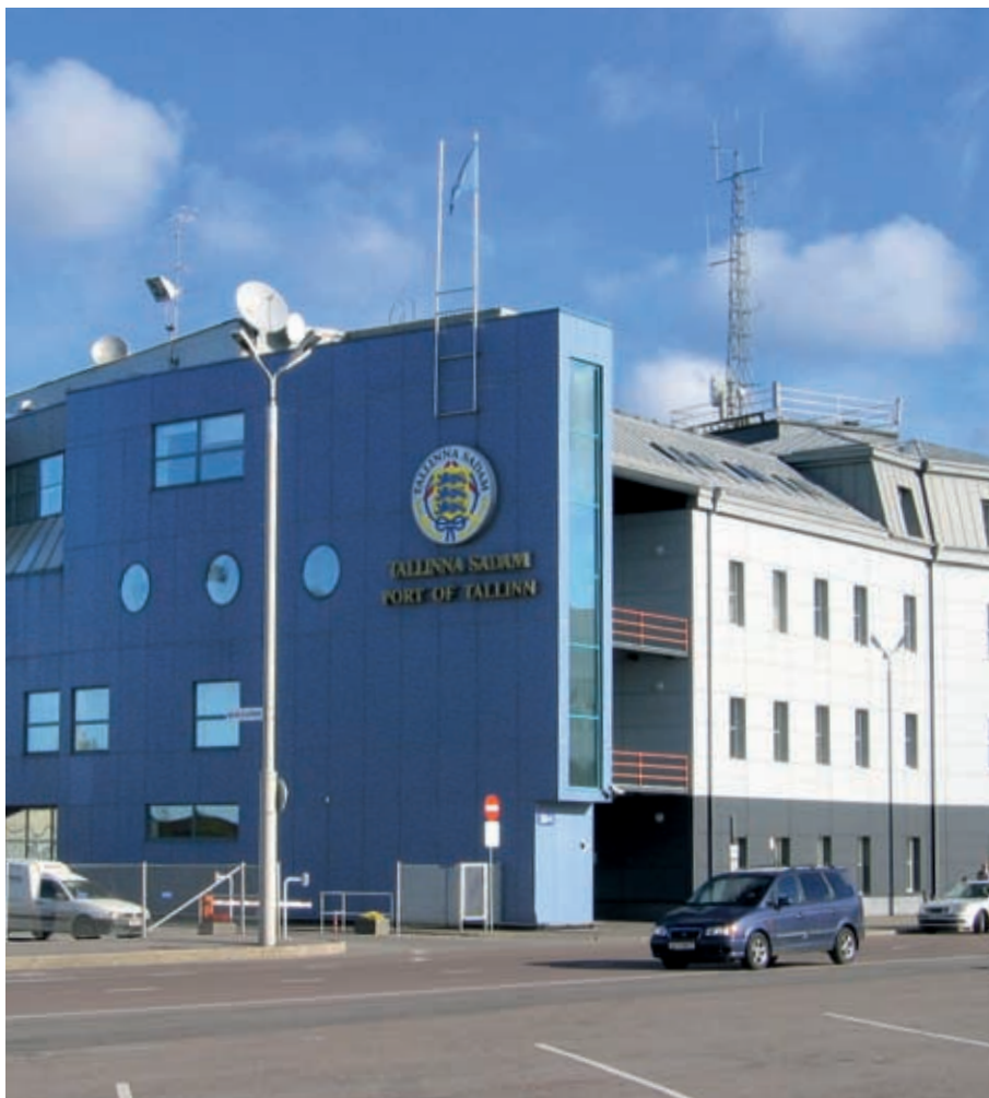
Tallinna Sadam haluaa hyödyntää Tallinnan vanhan keskustan lähellä sijaitsevan matkustajasataman maa-alueita ja pyrkii kehittämään sitä kaupallisesti.

Yhtiö aikoo investoida satamiinsa yli 340 miljoonaa euroa vuosina 2004–2008.