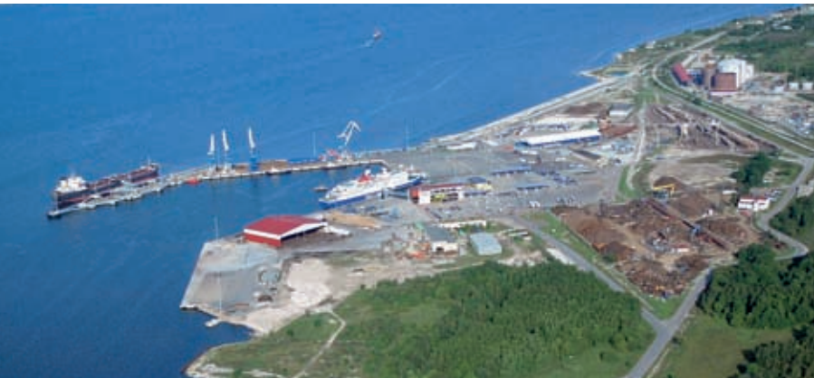
Paldiskin satamassa järjestettiin neuvostoajalla sukellusvenekoulutusta. Satama on pieni, mutta Tallinna Sadam näkee siinä suuria mahdollisuuksia. Pääpaino on roro-liikenteessä, virolaisten tavaroiden viennissä sekä nestebulkin ja metallin kuljetuksissa.