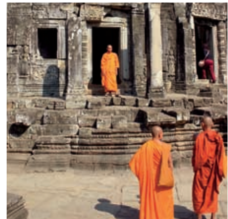
Kambodža on yksi NDF:n uusista yhteistyömaista.

sähköä Vietnamista ja laajentamalla jakeluverkkoa köyhimmille väestöryhmille.