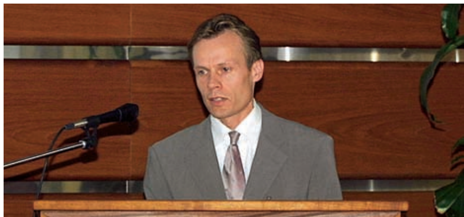
Liettuan suurlähettiläs Audrius Brūža.