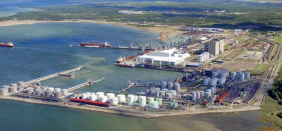
Muugan vuonna 1986 perustettu satama on Itämeren alueen syvin, ja nyt sitä laajennetaan. Tallinna Sadam -yhtiöllä on yhteensä neljä satamaa.