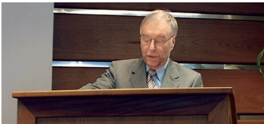
Latvian suurlähettiläs Valdis Krastiņš.