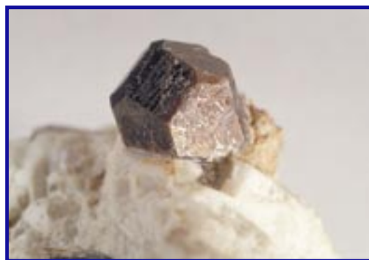
Рис. 5. Фекличевит \text{Na}_{11}\text{Ca}_9(\text{Fe}^{3+}, \text{Fe}^{2+})_2\text{Zr}_3\text{Nb}[\text{Si}_{25}\text{O}_{73}](\text{OH}, \text{H}_2\text{O}, \text{Cl}, \text{O})_5 – новый минерал из Ковдорского щелочного массива на Кольском полуострове, открытый в 2000 году и названный в память о российском минералогe В.Г. Фекличеve. Кристалл имеет 1 см в поперечнике.

пегматитов присутствует до 4–5 различных анионных группировок, занимающих собственные структурные позиции: таков, например, минеевит \text{Na}_{25}\text{Ba}(\text{Y}, \text{Gd}, \text{Dy})_2(\text{CO}_3)_{11}(\text{HCO}_3)_4(\text{SO}_4)_2\text{F}_2\text{Cl} – новый минерал из Ловозерского массива. Содержания натрия и калия при формировании пород этого типа настолько велики, что лишь очень немногие из сотен известных здесь минералов не содержат этих элементов: щелочные ме-