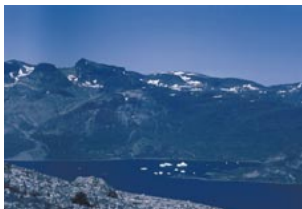
Рис. 4. Илимаусакские горы в Юго-Западной Гренландии: отсюда в начале XIX века были привезены в Европу первые образцы высокощелочных пород с неизвестными минералами.