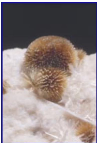
Рис. 3. Раит \text{Na}_3\text{Mn}_3\text{Ti}_{0,25}[\text{Si}_2\text{O}_5]_4(\text{OH})_2 \cdot 10\text{H}_2\text{O} – минерал из Ловозерского щелочного массива на Кольском полуострове, названный в честь международной научной экспедиции 1969–1970 гг. на папирусной лодке “Ра” под руководством Тура Хейердала. Диаметр самой крупной “шишки” 2 мм. Образец из коллекции А.С. Подлесного

пегматитов присутствует до 4–5 различных анионных группировок, занимающих собственные структурные позиции: таков, например, минеевит \text{Na}_{25}\text{Ba}(\text{Y}, \text{Gd}, \text{Dy})_2(\text{CO}_3)_{11}(\text{HCO}_3)_4(\text{SO}_4)_2\text{F}_2\text{Cl} – новый минерал из Ловозерского массива. Содержания натрия и калия при формировании пород этого типа настолько велики, что лишь очень немногие из сотен известных здесь минералов не содержат этих элементов: щелочные ме-