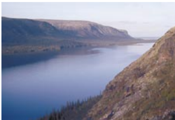
Рис. 2. Ловозерские тундры на Кольском полуострове – не только “чемпион мира” по числу впервые открытых минералов, но и одно из самых живописных мест Европейской России.