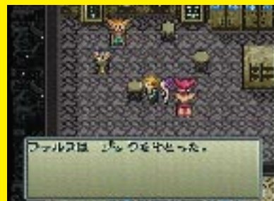
傭兵達の力を借りて「大統」を自指せ!