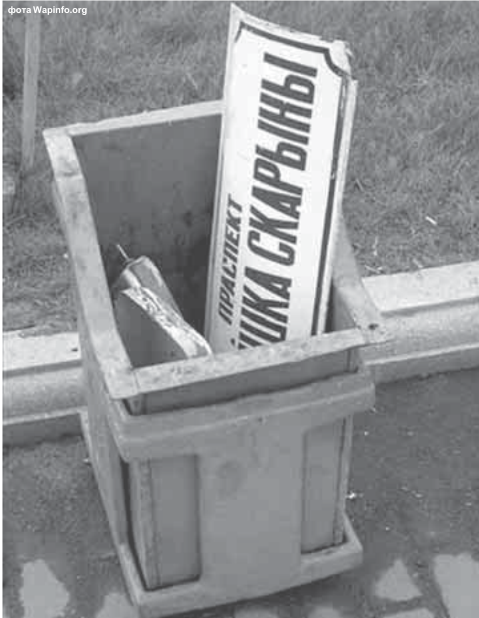
Сённяшняя ўлада ў Беларусі і пашана да спадчыны