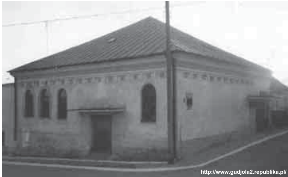
Быўшая синагога ў Крынках

Як ствараецца традыцыя? Непрыкметна. Год за годам, справа за справай. Цікавасцю, жаданнем, захопленасцю, настойлівасцю людзей. Усіх гэтых якасцей з лішкам хапае вучням і настаўнікам дзвюх навучальных устаноў: гімназіі № 1 горада Гродна і гімназіі мястэчка Крынкі ў Падляшскім ваяводстве.