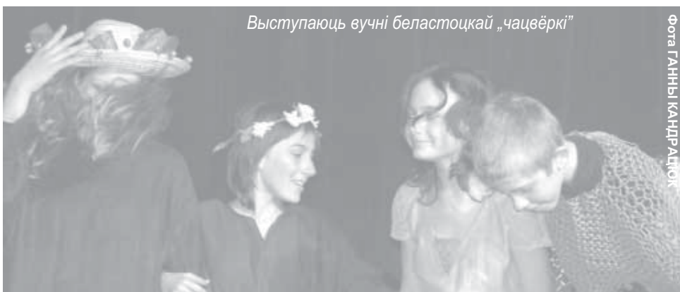
Выступаюць вучні беластоцкай „чацвёркі”