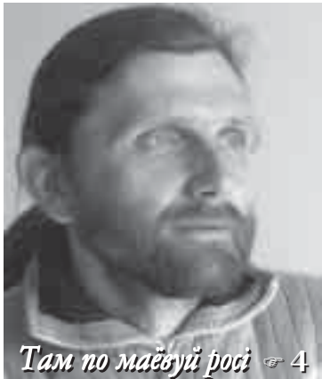
Там по маёўці росі 4