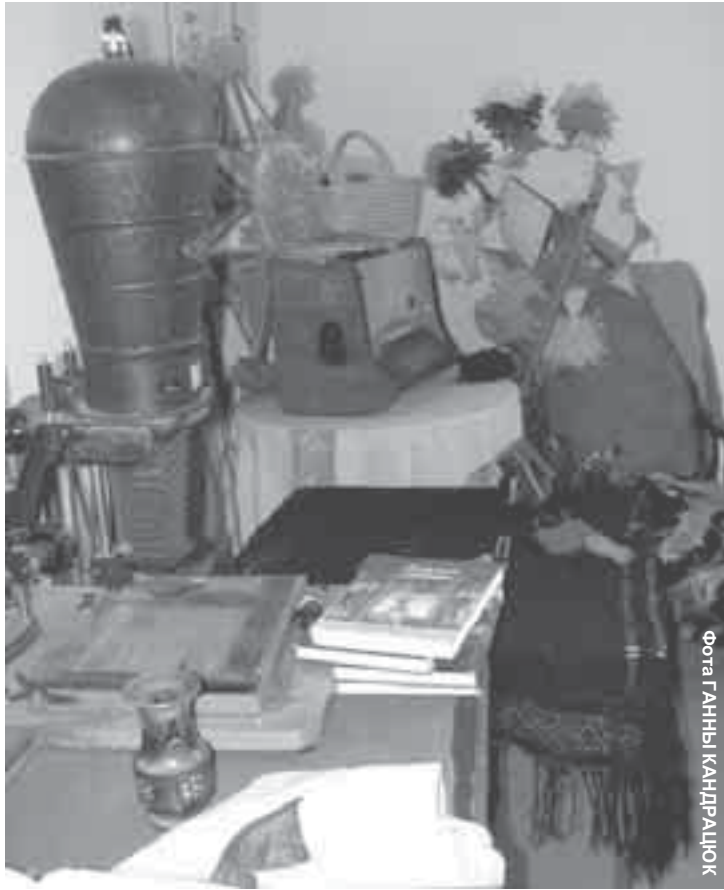
Рэгіянальная ізва ў Ягуштове

ную ізбу. Яна асаблівая. Тут захаваны прадметы Яўгена Аніські — легендарнага настаўніка беларускай мовы, фотаамагара, музыканта, журналіста ды беларускага дзеяча. На пісьмовым сталі Аніські стаіць стары, падобны на самавар, фатаграфічны праектар. Побач яго фатэль. На ім фотаапарат у скураным футарале. Тут, сярод гісторыі ды этнаграфічных экспанатаў з Бельшчыны, прадаўжаюцца рэпетыцыі песні. Ігар Лукашук сустрэкаецца тут са сваімі крэзнаўцамі. Разам вывучаюць мікратапанімы з Ягуштова і іншых вёсак.