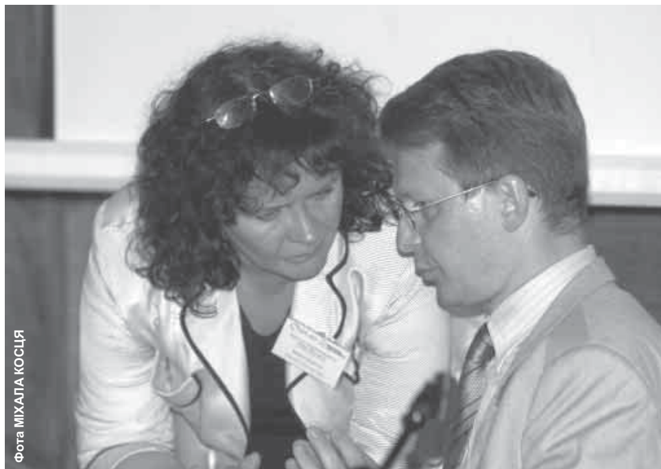
Еўрадепутатка Барбара Кудрыцкая і Вінцук Вячорка — лідэр Беларускага народнага фронту

Пад дэкларацыяй першымі подпісы паставілі лідэр ГП Дональд Туск, былы прэзідэнт Літвы а сёння еўрадепутат Вітаўтас Ландсбергіс, старшыня Беларускага народнага фронту Вінцук Вячорка, віцэ-старшыня Аб’яднанай грамадзянскай партыі Аляксандр Дабравольскі і віцэ-старшыня Еўрапарламента Яцэк Сарыюш-Вольскі.