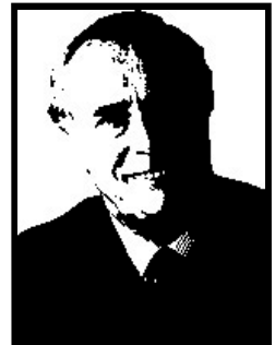
GIAMPIERO CANTONI senatore Forza Italia

1 anno e 6 mesi patteggiati a Milano per corruzione per le tangenti autostradali del Veneto; 6 mesi patteggiati per finanziamento illecito Enimont.