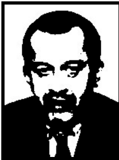
ROBERTO MARONI deputato Lega Nord e ministro Lavoro

1 anno e 4 mesi patteggiati per truffa ai danni del Ministero del Lavoro e della CEE per 474 milioni di lire in cambio di falsi corsi di qualificazione professionale per la sua azienda.