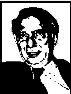
PAOLO CIRINO POMICINO eurodeputato Udeur

Come ex presidente della Bnl in quota Psi, inquisito e arrestato per corruzione, bancarotta fraudolenta, ha patteggiato la pena e risarcito 800 milioni.