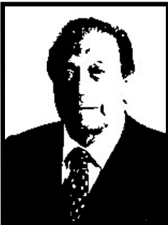
WALTER DE RIGO senatore Forza Italia

1 anno e 4 mesi patteggiati per truffa ai danni del Ministero del Lavoro e della CEE per 474 milioni di lire in cambio di falsi corsi di qualificazione professionale per la sua azienda.