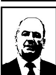
AUGUSTO ROLLANDIN senatore Union Valdotaïn-Ds

Ex sindaco socialista di Asti, nel '96 ha patteggiato 6 mesi e 26 giorni di carcere per inquinamento delle falde acquifere, abuso e omissione di atti ufficio, falso ideologico, delitti colposi contro la salute politica (per l'inquinamento delle falde acquifere) e omessa denuncia dei responsabili della Tangentopoli astigiana nello scandalo della discarica di Vallemantina e Valleandona (smaltimento fuorilegge di rifiuti tossici e nocivi in cambio di tangenti).