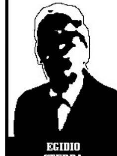
EGIDIO STERPA deputato Forza Italia

2 mesi e 20 giorni patteggiati per finanziamento illecito Enimont; 1 anno 8 mesi e 20 giorni patteggiati per i finanziamenti illeciti della metropolitana milanese.