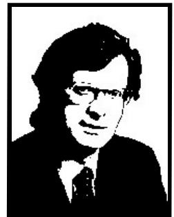
VITTORIO SCARBI deputato Forza Italia

6 mesi definitivi per truffa aggravata e continuata ai danni dello Stato, cioè del Ministero dei Beni Culturali.