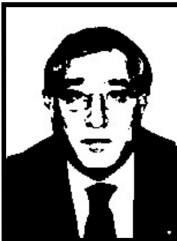
MARCELLO DELL'UTRI senatore Forza Italia e membro del Consiglio d'Europa

8 mesi definitivi per favoreggiamento nel processo tangenti Guardia di Finanza.