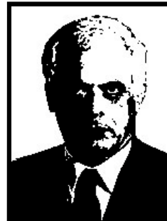
VINCENZO VISCO deputato Ds

Condannato a Milano a oltre 6 anni di reclusione definitivi per le tangenti delle discariche (3 anni e 9 mesi, corruzione) e per altri due scandali di Tangentopoli (2 anni e 11 mesi per concussione, corruzione, ricettazione e finanziamento illecito).