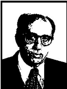
LINO JANNUZZI senatore Forza Italia

1 anno e 8 mesi definitivi per finanziamento illecito tangente Enimont, 2 mesi patteggiati per corruzione per fondi neri ENI.