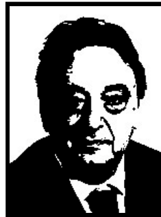
GIANNI DE MICHELIS eurodeputato Socialisti Uniti per l'Europa

Già sindaco di Agrigento, condannato definitivamente a 1 anno e 6 mesi per abuso d'ufficio finalizzato a favorire i costruttori abusivi in cambio di favori elettorali.