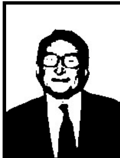
GIANSTEFANO FRIGERIO deputato Forza Italia

Condannato definitivamente a 2 anni e 4 mesi per diffamazioni varie, è stato graziato dal Capo dello Stato proprio mentre stava per finire in carcere.