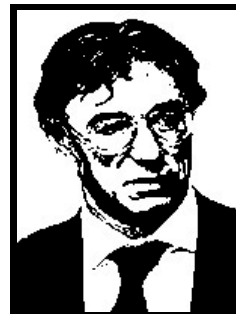
UMBERTO BOSSI eurodeputato e segretario Lega Nord

2 anni definitivi per frode fiscale e false fatturazioni a Torino (false fattura Publitalia); ha patteggiato a 6 mesi a Milano per altre vicende di false fatture Publitalia.