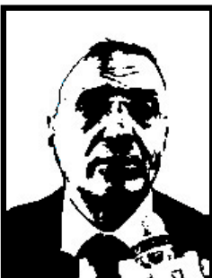
GIORGIO LA MALFA deputato Pri, ministro politiche comunitarie

Condannato definitivamente dalla Cassazione nel 2001 per abusivismo edilizio, per via di alcuni ampliamenti illeciti nella sua casa a Pantelleria; 10 giorni di arresto e 20 milioni di lire di ammenda, più "l'ordine di pristino dei luoghi". Cioè la demolizione delle opere abusive.