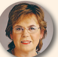
Ela Tomson (60, Pärnumaa) Riigikogu liige