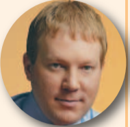
Marko Mihkelson (36, Valgamaa) Riigikogu väliskomisjoni aseesimees