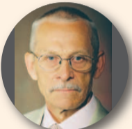
Henn Pärn (64, Harjumaa) Riigikogu liige