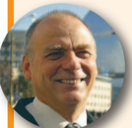
Tõnis Palts (52, Tallinn) Tallinna linnaape