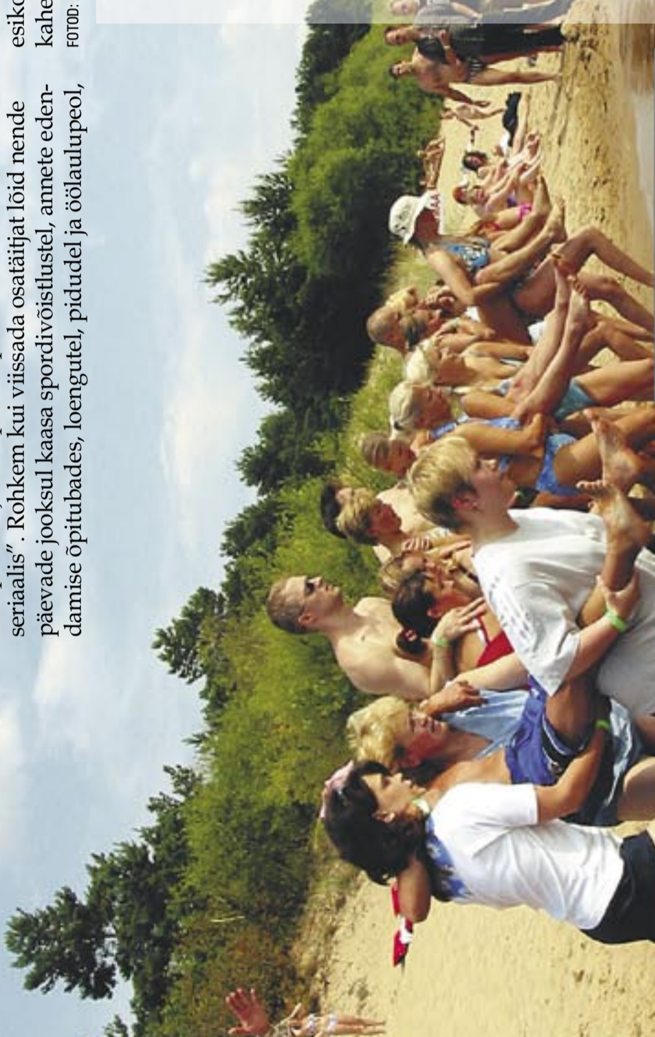
Päikseline "Paradise Beach" muutus kuumaks võistlusareeniks, kui starti asusid mehekandjad – viievõistluse teisel alal pidi piirkonna naised läbi vee ja liiva kandma finišisse ühe omakandi mehe.