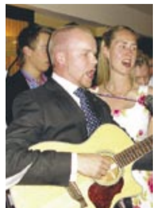
Suvekool tähendas ka ühiseid pidusid.