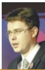
Urmas Reinsalu Riigikogu liige

Viimasel ajal on palju juttu olnud meie erakonna ja poliitika ideoloogilistest küsimustest. Minu hinnangul on Res Publica paremsentristlik rahvapartei, mille ideoloogiliseks teljeks on konservatism.