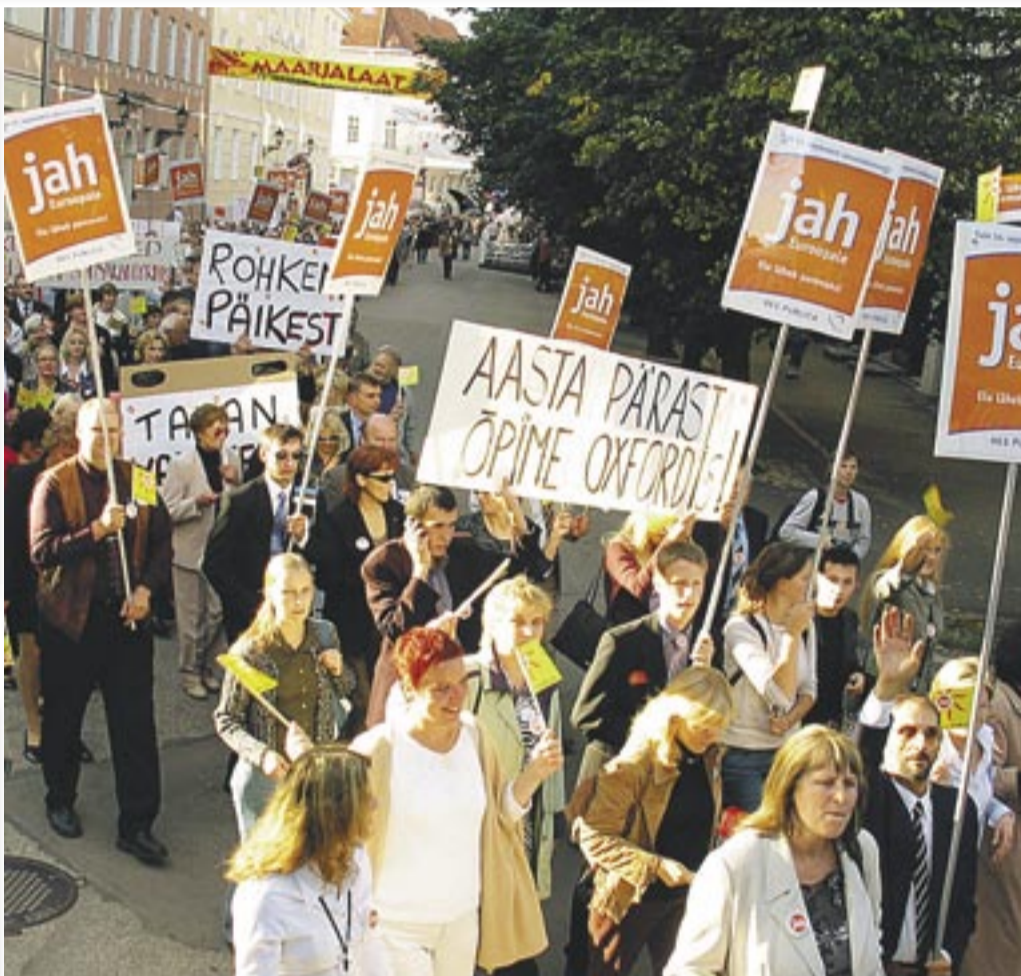
Eelmisel aastal nädal enne Euroopa referendumit Tartus kogunenud üldkogu võttis vastu poliitilise avalduse, milles kinnitas toetust liitumisele. Seda näidati ka üldkogule järgnenud rongkäigus.