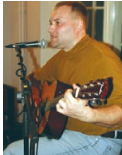
Üllatusesinejast tõusis õhtu täheks Tallinna abilinnapea, kitarrimängu- ja laulutaidu demonstreerinud Kaupo Reede. Algselt plaanitud mõne laulu järel ei tahtnud kuulajad teda veel ära lasta ning nõnda viis Reede saali maleva-meeleollu enam kui pooleks tunniks.