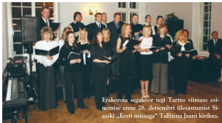
Erakonna segakoor tegi Tartus viimase esinemise enne 28. detsembri ülesastumist Sisaski „Eesti missaga“ Tallinna Jaani kirikus.