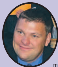
Marko Pomerants, sotsiaalminister