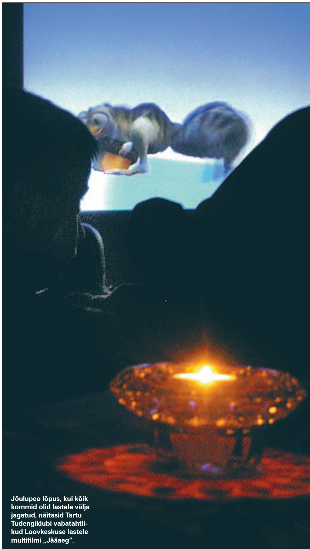
Jõulupeo lõpus, kui kõik kommid olid lastele välja jagatud, näitasid Tartu Tudengiklubi vabatahtlikud Loovkeskuse lastele multifilmi „Jääaeg“.