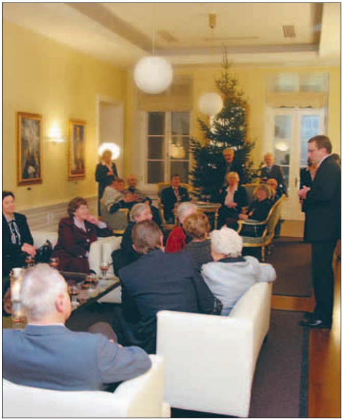
Esmapäeval, 15. detsembril võttis peaminister Juhan Parts Stenboggi majas vastu Väärikate klubi liikmeid.