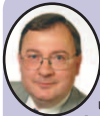
Tiit Matsulevitš , Riigikogu liige, loosungi „Vali kord!“ autor

Vaidlused koalitsioonipartneritega on paratamatud ja loomulikud. Enamasti viivad need mõistliku kompromissini, kuid miski ei välista järgmist kriisi. Igal erakonnal on oma valijad ning põhimõtted, kuidas nende soovidele vastata. Riigikogu Res Publica fraktsioon tahab pakkuda Eestile stabiilset riiki ja selle nimel töötame uuel aastal veelgi usinamalt.