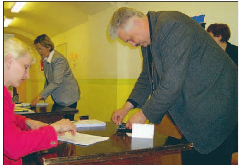
Europarlamenti kandidaat Ela Tomson ja Riigikogu liige, Pärnumaa piirkonna esimees Aivar Õun käisid neljapäeval Pärnus eelvalimistel.

Eelhääletamine toimub 7.- 9. juunil kõigis valimisjaoskondades kell 12.00 - 20.00. Eelhääletamise ajal saab hääletada ka väljaspool oma elukohajärgset valimisjaoskonda. Igas vallas ja linnas on vähemalt üks selline valimisjaoskond, mis korraldab väljaspool elukohajärgset valimisjaoskonda hääletamist.