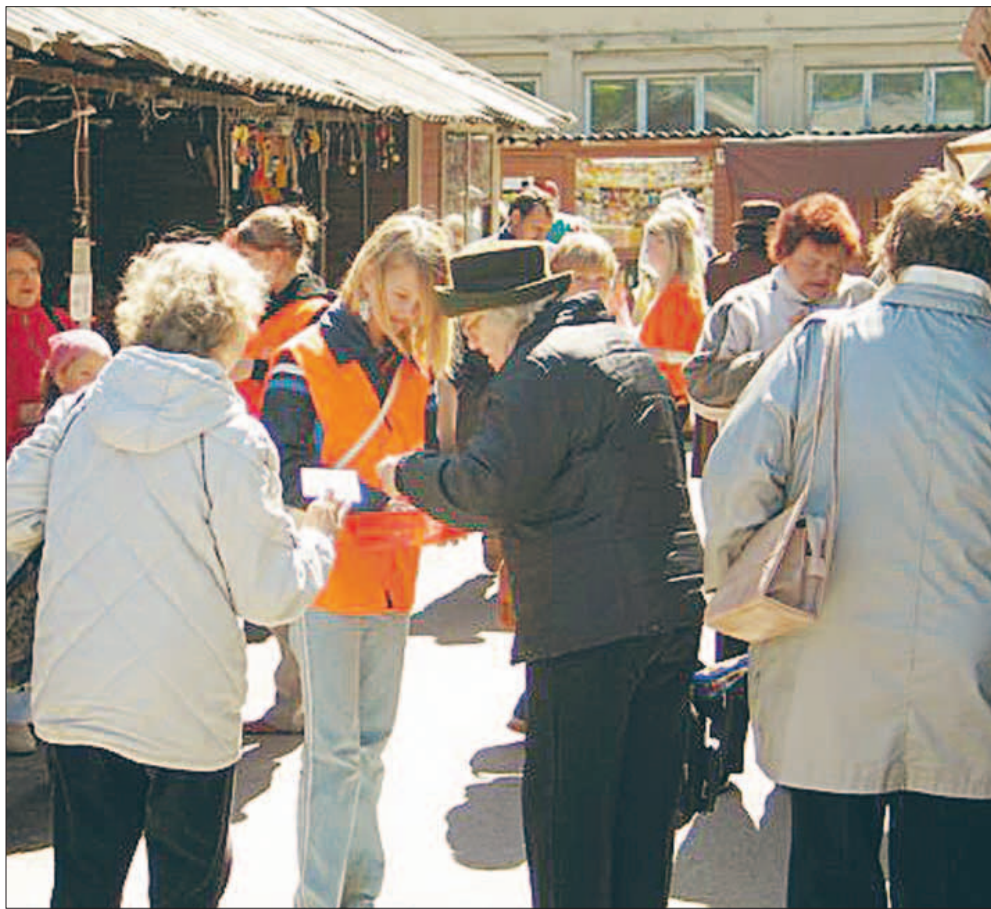
Laupäeval, valimiskampania viimasel päeval aita meie A-rühmi ja kandidaate, kes igal pool kaubanduskeskustes, turgudel ja avalikel üritustel oranzhide vestidega kampaniat teevad. Küsi nende käest materjale ja aita neid laiali jagada.