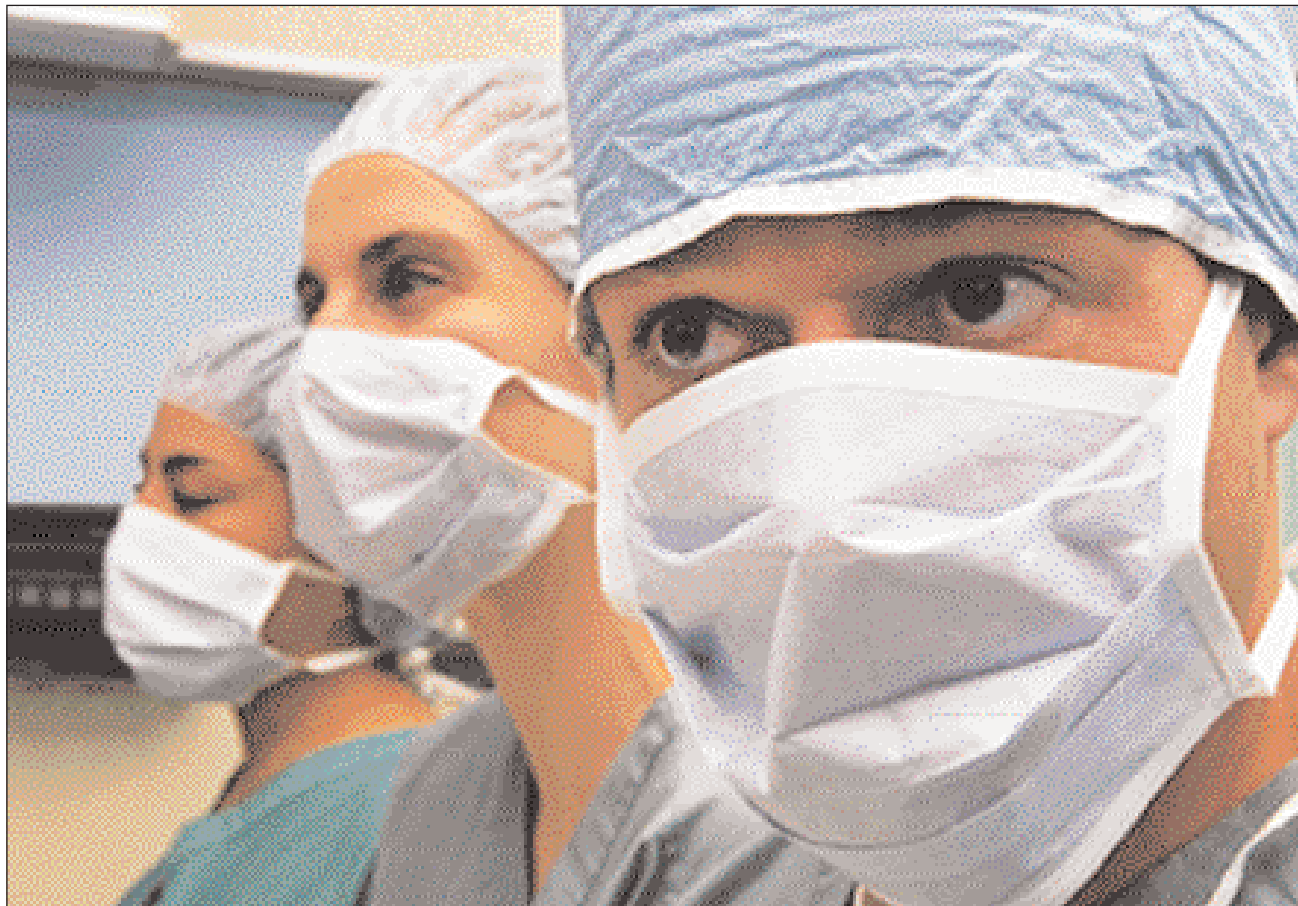
Eesti meditsiinitöötajate palgad küll tõusevad, kuid peaminister Juhan Parts hinnangul ei jõua palgad lääneriikide tasemele veel lähema viie või kümne aasta jooksul.