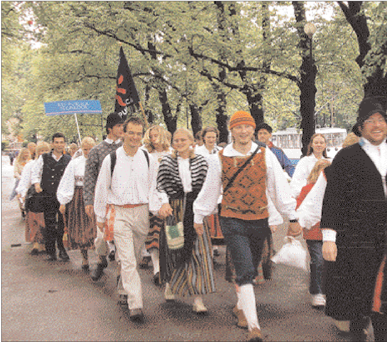
Res Publica lipp lehvimas, kõndisid erakonna koori liikmed koos paari teise kooriga mööda Tallinnat, tehes endale ise rongkäigu, sest ametlik rongkäik jäi ära ning mitteametlikke oli linna peal veel mitmeid. Respublikaanide ees kõnnib Tallinna Kammerkoor.