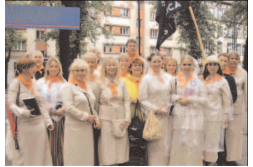
Res Publica segakoor – üles rivistatud ja valmis laulma.