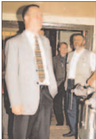
Haridus- ja teadusminister Toivo Maimets.