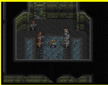
戦闘はシミュレーション風になっている

さらにゲームを十分楽しめるように、プレイの決め手となる魔法を表にまとめてみた。この一覧を参考に、自分だけのキャラクターを作ってみよう。