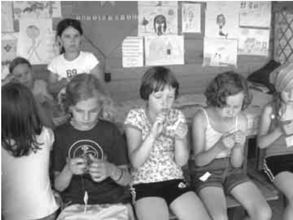
Самыя любімыя заняткі малых летнікаў: вышыванка...