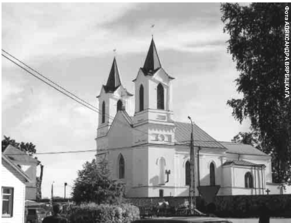
Касцёл у Новым Двары

Я стараюся ёй патлумачыць, што названая балбатня гэта пустая і хлуслівая гаворка, а ў мяне цікавасць не да яе, але да канкрэтных і выпрабаваных фактаў. Ну, але кабета, як гэта кабета, сваё і так ведае.