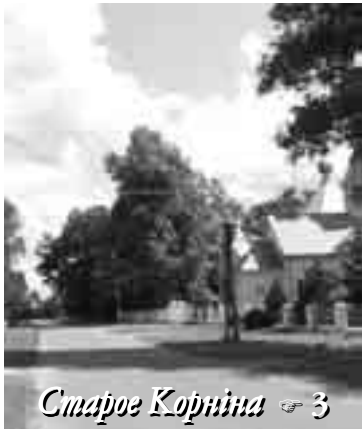
Старое Корніна 3