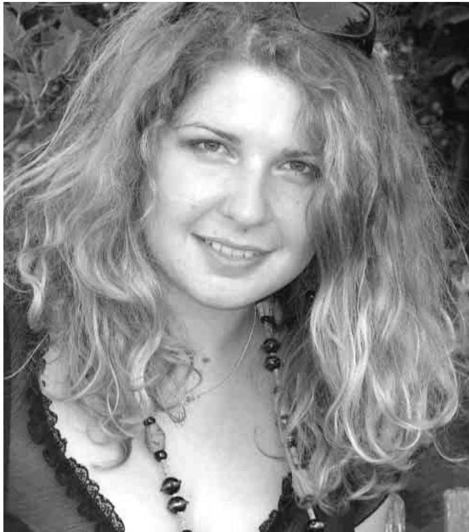
— На „Басовішча” прыбываюць і цэлыя сем’і ды яны таксама знаходзяць сваё месца...

— На Беласточчыне атмасфера спрыяе таму, каб выходзіць на беларускай фальклорнай музыцы і ад гэтага я не адракаюся. Побач калектываў, якія маглы я ўбачыць і пачуць на фестывалю, з’явілася рок-музыка —