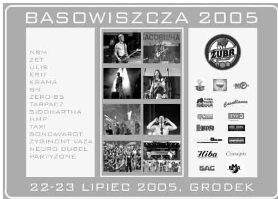
Плакат сёлетняга Фестывалю