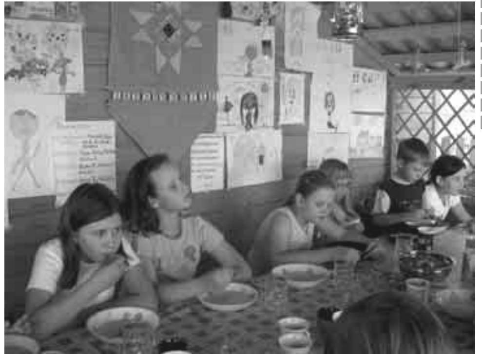
... і яда

У Сацах увесь свет беларускі. Усюды чуваць беларускую мову. У час храмавога свята св. апоста-