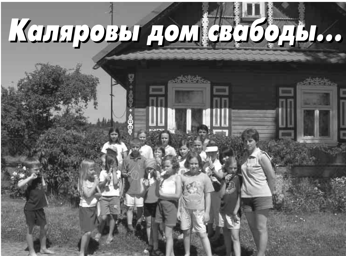
У Сацах адпачывалі наймалодшыя

Другі беларускі летнік для малодшых дзетак наладзілі ў самай прыгожай вёсцы Бласточчыны — у Сацах. Дзень пасля Такароў — з 11 па 16 ліпеня. Мясціна знаходзіцца ў „Краіне адкрытых аканіц”. Проста, тут казачныя хаткі з размаляванымі аканіцамі і арнаментамі. Вёска мае дзве вуліцы. Між імі, паміж квяцістымі лугамі і спеючым жытам, уецца рачулка. На краю вёскі — стары лес.