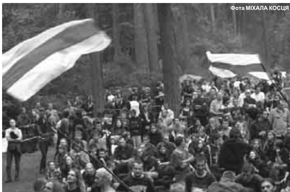
Успамін „Басовішча 2002”