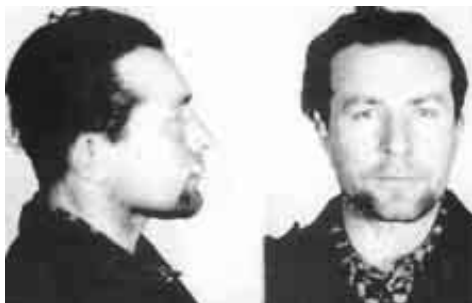
Для беларусаў „Буры” не герой падполля, а крыміналіст і ваенны злачынца

і пабітых ім блізкіх нявінных людзей. Таксама не забудзе трагедыі вёска Патока Беластоцкага павета, якую спаліў атрад „Лупашкі” і памардаваў нявінных яе жыхароў.