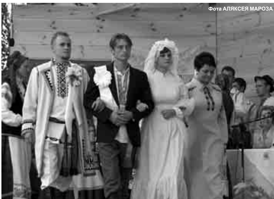
Маладая пара вярнулася з царквы пашком

акцёры. Галоўныя вясельныя ролі выпалі жыхарам Беластоцчыны. Калектывы з Беларусі найчасцей выступалі ад імя гасцей. Паказалі яны свае вакальныя і танцавальныя ўмеласці, а ў размове высветлілася, што некаторыя вельмі добра ведаюць ход вясельных абрадаў.