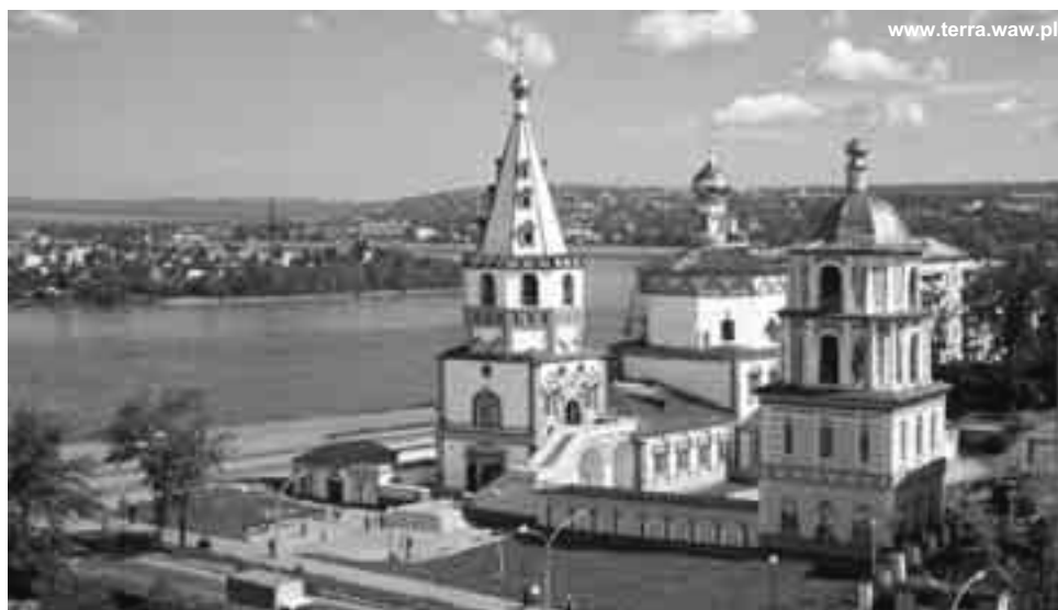
Богаяўленская царква ў Іркуцку

— Іркуцк гэта шматнацыянальны рэгіён. Згодна з апошнім перапісам, у нас ёсць прадстаўнікі 117 народаў. Найбольш буйныя прадстаўнікі гэта: рускія, бураты, татары, украінцы і беларусы. Палякамі запісалася недзе каля дзвюх тысяч.