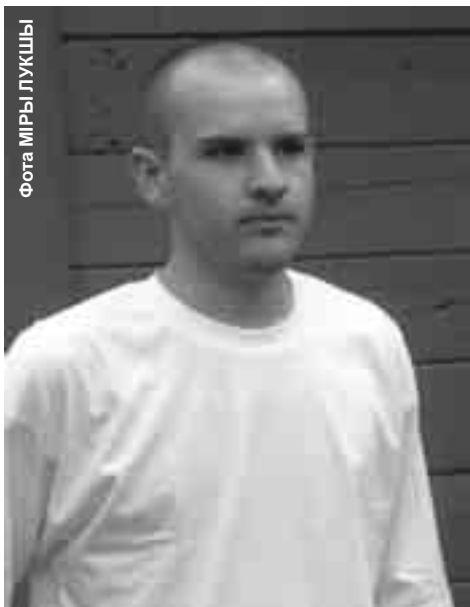
Павал Гжэсь шануе сваіх