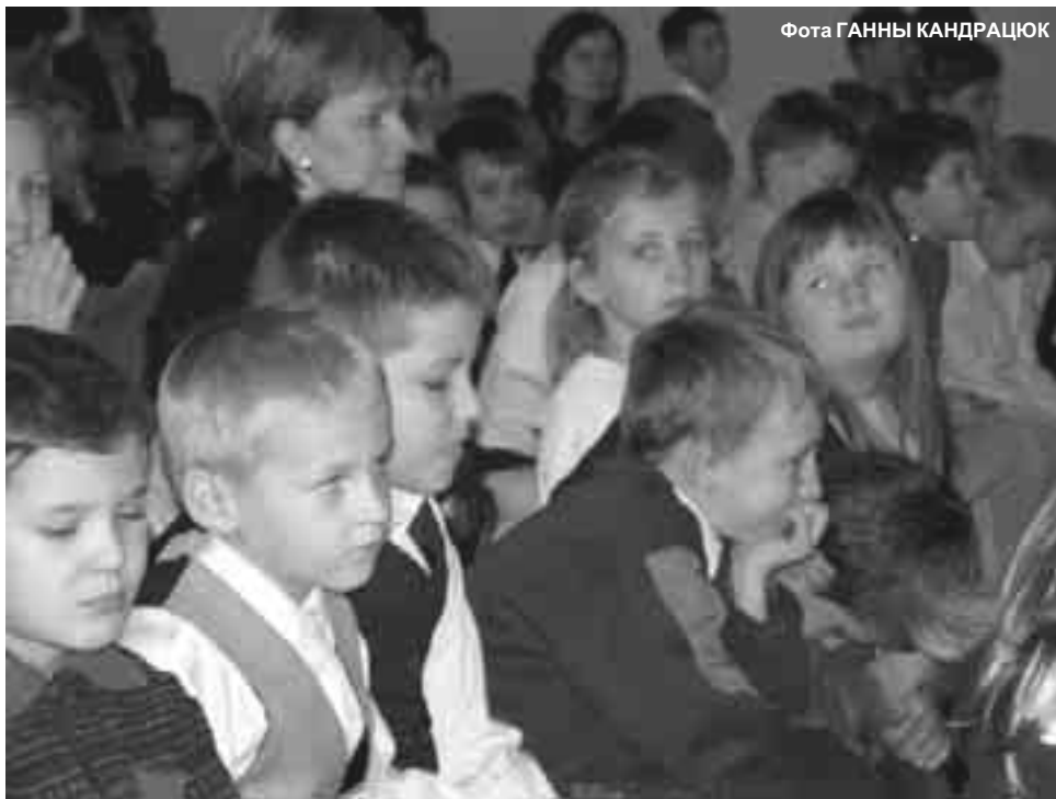
Пачатак навучальнага года ў Гарадку