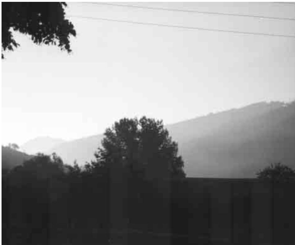
Змак жажлівага Эндзі-Дракулы стаяў на гары Джгар