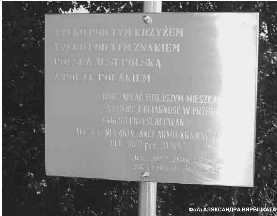
Надпіс на крыжы між Кусцінцамі і Крыштапаровам

У Паўловічах зямлю бедным саветы раздавалі. А як немцы наступалі, то паўвёскі спалілі. І аднаго забілі. Пасля дзве сям’і вывезлі ў Германію і некалькіх самотных; дзве асобы там прапала.