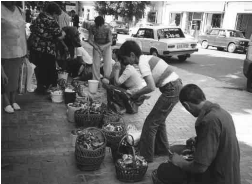
Апрача перцу тут спажываюць процьму грыбоў і бэтак, якія ў нас лічацца неядомымі