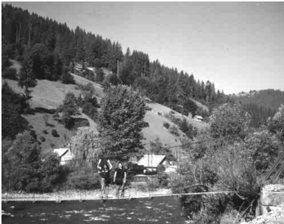
Шлях ішоў паўз раку Цісу і я ўяўляла, што плыву на гуцульскім пляце

Адны шафёры маршрутак (мікрааўтобусаў) трымаюць моцна лейцы ў руках. Нягледзячы на сціск і пякельную жару, падбяруць з дарогі кожнага пасажыра, нават калі ўсярэдзіне няма ўжо ні міліметра. У такі сціск загрузыць групу турыстаў