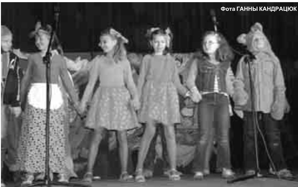
Дзяўчаты з Чыжоў