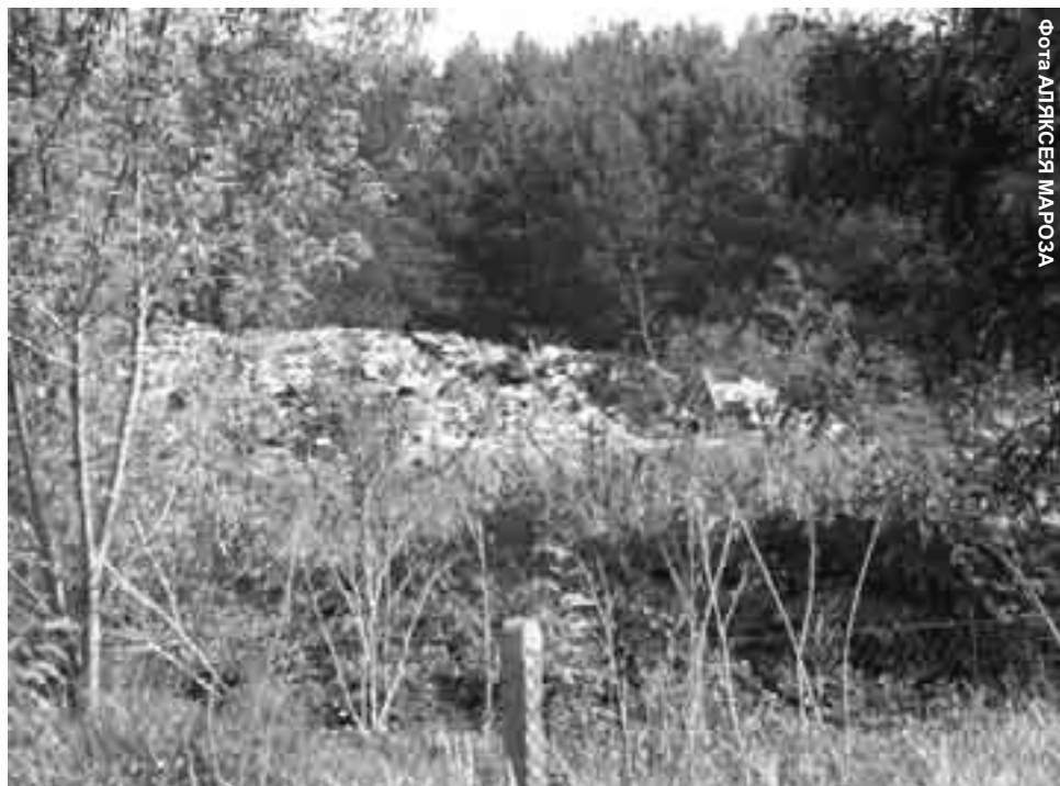
Зараз смецце з Гайнаўкі складаецца ў адвалах

— Ужо дваццаць гадоў таму нашы бацькі намагаліся ліквідаваць гарадскую звалку смецця, пратэставалі, але гарадскія ўлады іх ігнаравалі. Мы заклікаем знайсці новае месца для будовы прадпрыемства гаспадаркі адкідамі і патрабуем прывесці ў парадак месца сённяшняй звалкі. Трэба было б выбраць усё смецце і адкіды закапаныя ў зямлі да 7 метраў углыб. Мы хочам, каб забралі закапаныя там азбест, акумулятары, свінец, якія разам з іншымі адкідамі могуць стаць экалагічнай бомбай, якую заражам, — заявіў хвалюючым голасам Адам Мончка, жыхар вуліцы Парыева. — Мы не хочам звалкі каля жылых дамоў і заповедніка птушак.