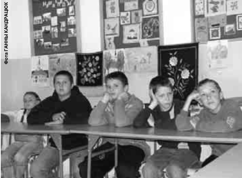
Хлопцы з ПШ № 3 у Бельску-Падляшскім