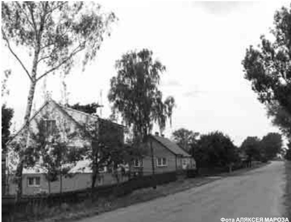
У Курашаве многа прыгожых дамоў, збудаваных яшчэ перад гаспадарчымі і грамадскімі пераменамі