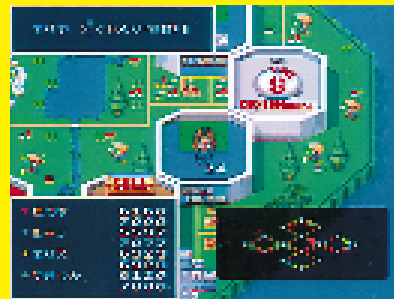
「運がすべて」なんて言っているようでは勝てないよ

営業利益に大打撃を与えられるぞ。その2 / 特等地を乗っ取る 特等地は乗っ取ることができる。やり方はそのエリアの株を過半数以上所有して、その土地に止まることだ。手塩にかけた他人の特等地をまるまる頂いちゃおう。その3 / 株はまとめて買おう 株を購入する時は最低でも10枚単位で買おう。その方が株価が上昇しやすいぞ!