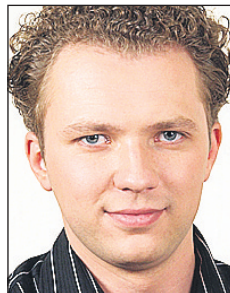
Margus Tsahkna Isamaaliidu juhatuse liige

Eesti teadlaste ja innovaatiliste ettevõtjate ning tippasemel tööjõu tööviljad tuleb rakendada ühiskonnarenguks. Inimestele tähendab see uute kõrgepalgaliste töökohtade loomist ning heaolu tõusu.