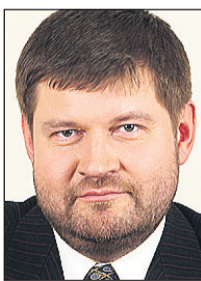
Mart Nutt Riigikogu liige