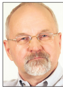
Peeter Tulviste Riigikogu liige