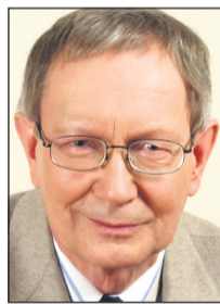
Tunne Kelam Europarlamendi liige