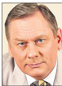
Trivimi Velliste Riigikogu liige