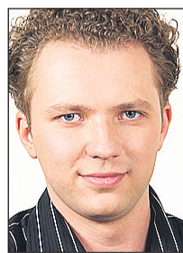
Margus Tsahkna Tartu prk esimees