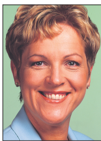
Kaia Iva Türi linnaapea