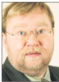
Mart Laar Riigikogu liige