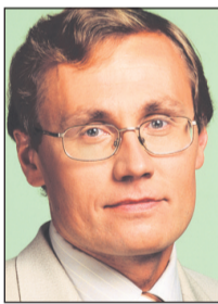
Tõnis Lukas Erakonna esimees