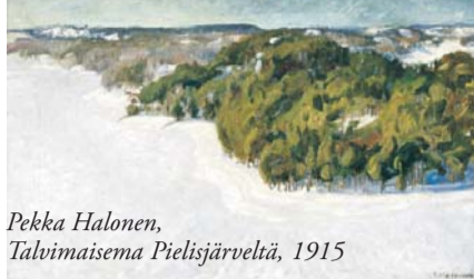
Pekka Halonen, Talvimaisema Pielisjärveltä, 1915