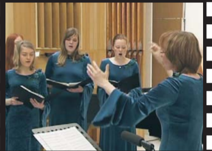
Kuorolaulu kiinnostaa kaikenikäisiä