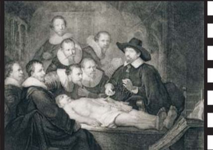
Rembrandtin grafiikkaa Järvenpään Taidemuseossa