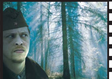
Suomies astuu Järvenpään Teatteriin