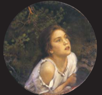
Nuoren Suomen Piiri esittäytyy Halosenniemessä