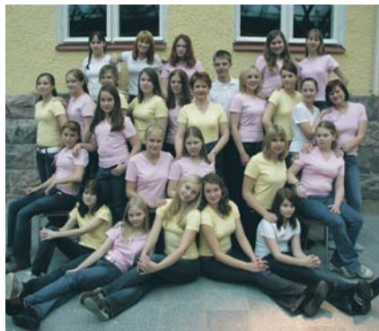
Keravan musiikkiopiston nuorisokuorossa vallitsee rento tunnelma.

Porvoonseudun musiikkiopisto järjestää opetusta kolmentoista kunnan alueella, joista Kuuma-kuntiin kuuluvat Mäntsälä ja Pornainen. Pornaisissa toimii ala-asteikäisille suunnattu Nappula-kuoro. Tämän lukuvuoden aikana on tarkoitus kartoittaa Mäntsälän ja Pornaisten kiinnostusta pajatoimintaan ja soitonopetuk-