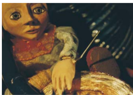
Sirkustyttö / Nukketeatteri AnnOs

9.11. klo 9.30 ja 11.30 Sylitaivas Lahelan nuorisotalo, Terttuseljankuja 1. Liput 2€, vauva & aikuinen, 1/2 tuntia ennen ovelta. Ikäsuositus 4–12 kk.