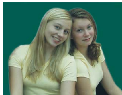
Keravan musiikkiopiston Laulupajassa yläaste- ja lukioikäisillä kuoroharrastajilla on mahdollisuus saada ohjausta sekä yksilöllisesti että ryhmässä.