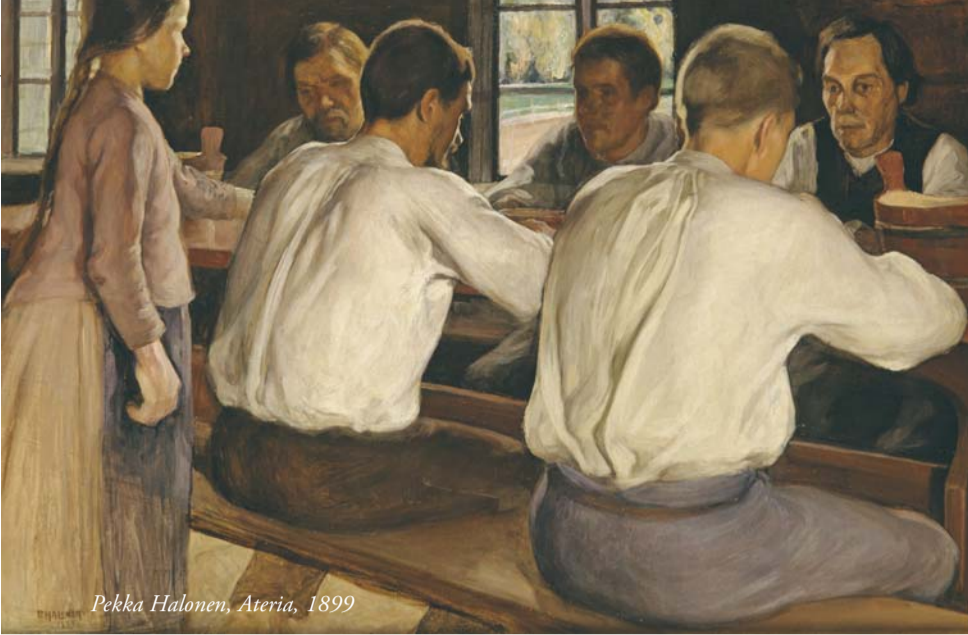
Pekka Halonen, Ateria, 1899