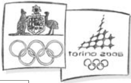
L'EMBLÈME DU CNO AUSTRALIEN AVEC LE KANGOUROU ET L'ÉMEU

Pour les médailles des Jeux Olympiques d'hiver, les anneaux sont représentés sans interruption dès les Jeux de Saint-Moritz (Suisse) en 1928 .