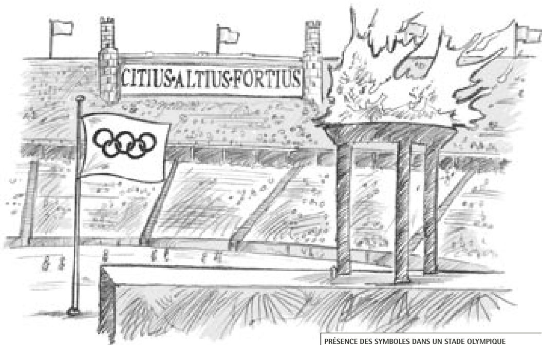
PRÉSENCE DES SYMBOLES DANS UN STADE OLYMPIQUE

Ces symboles permettent de transmettre un message de façon simple et directe. Ils donnent au Mouvement olympique et aux Jeux, une identité .