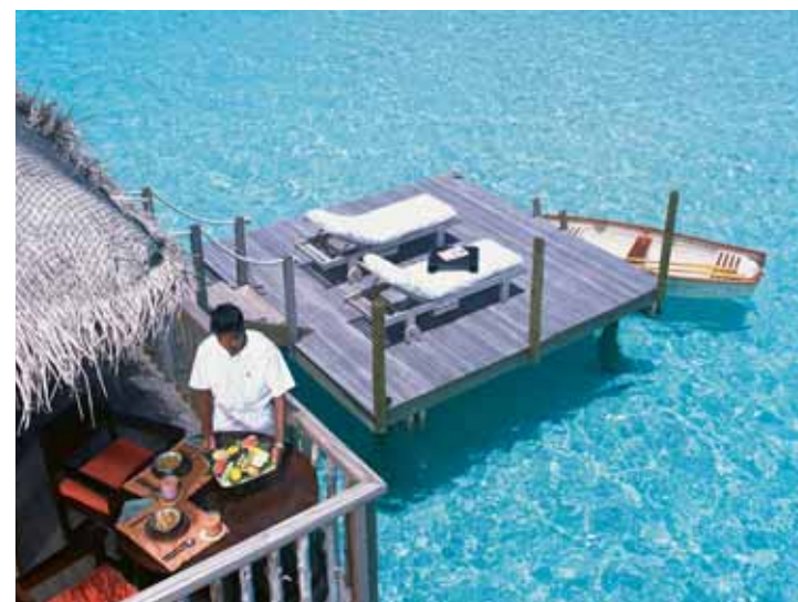
Dinner on the sun deck

Un spa privé avec un sauna, un hammam et une douche rafraîchissante, jouxte le pavillon de massage et la salle de gym. Enfin, un toboggan attendant au pavillon détente, offre aux hôtes la délicieuse possibilité de se laisser glisser dans le bleu du lagon. Sur 1400m 2 , la Private Reserve comprend également une cuisine, une cave à vins, ainsi qu'un vaste salon. Agrémenté de banquettes et sofas, il est agréable de s'y prélasser ou d'y savourer une nuit à la belle étoile.