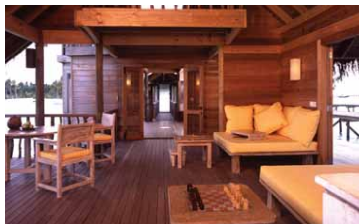
Villa Suite Lounge

La décoration intérieure des villas a été pensée dans l'idée de recréer un habitat très spacieux, le plus naturel possible. Les meubles sont en bambou, teck, jacinthe d'eau tressée, et bois recyclé. Fabriqués par des artisans locaux ou indonésiens, ils côtoient un équipement ultra moderne (chaîne hi-fi, lecteur DVD, chaînes satellites...) pour créer un habitat épuré, faussement rudimentaire et véritablement luxueux, en parfaite symbiose avec la nature environnante. La vedette restant inéluctablement la mer cristalline et poissonneuse, partout autour, et en dessous.