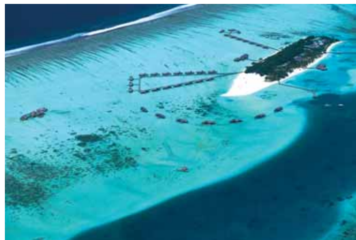
Soneva Gili Aerial

Les températures varient entre 25 et 30°C toute l'année. Il y a deux moussons annuelles. Une mousson du sud-ouest de mai à novembre, et une autre du nord-est, de décembre à avril (la haute saison) qui sont les plus secs.