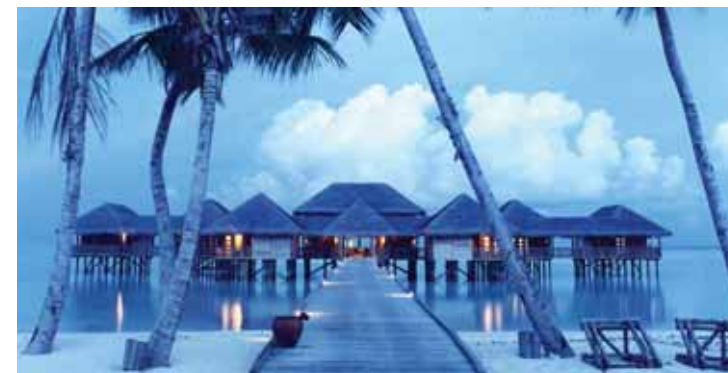
Six Senses Spa

- Visite du village de pêcheurs Himmafushi : A 15 minutes en dhoni de Soneva Gili se trouve le village de Himmafushi célèbre pour ses souvenirs faits mains.