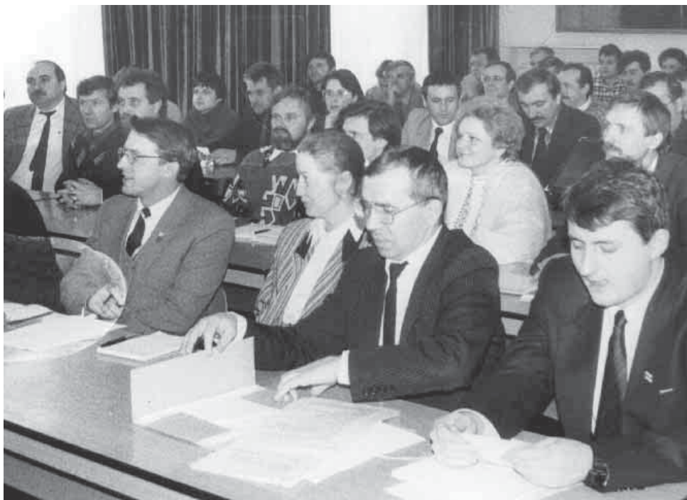
Другі Кангрэс Беларускага дэмакратычнага аб'яднання

Артыкул 38 закону ў сённяшнім выглядзе кажа, што палітычная партыя падае справаздачы з інфармацыяй аб крыніцах здабывання грошай, сярод гэтага аб банкаўскіх крэдытах, а таксама аб факце, што засноўвае Выбарчы фонд і ці на гэту мэту былі нейкія ўзносы ды падае адпаведны разлік. Палітычная партыя, якая не вядзе гаспадарчай дзейнасці, а падставай яе існавання з'яўляецца валоданне банкаўскім рахункам, такога абавязку не мае. Прынамсі закон гэтага не загадвае.