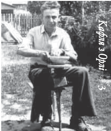
Каля з Орні 3