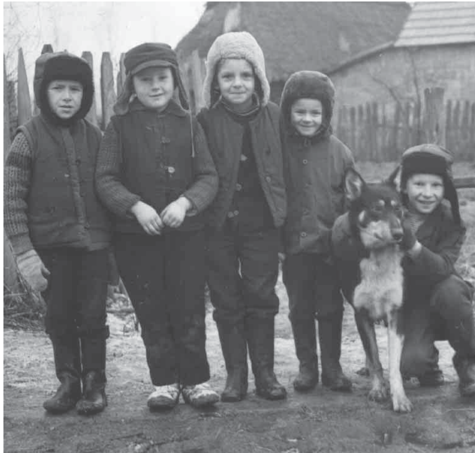
Дзеці з Тымянкі

За сямю лясамі ды за сямю балатамі жыў такі чарадзея, што ўсё мог рабіць. Пайшоў да яго той чалавек. Ідзе ён ды ідзе лесам, бачыць — ліпа абв'язана, думае — пчолы. Падышоў бліжэй, зірнуў, аж дупло зусім нізка, а ў ім мёд. Выдраў ён тыя пчолы і пайшоў далей. Бачыць — другое дрэва