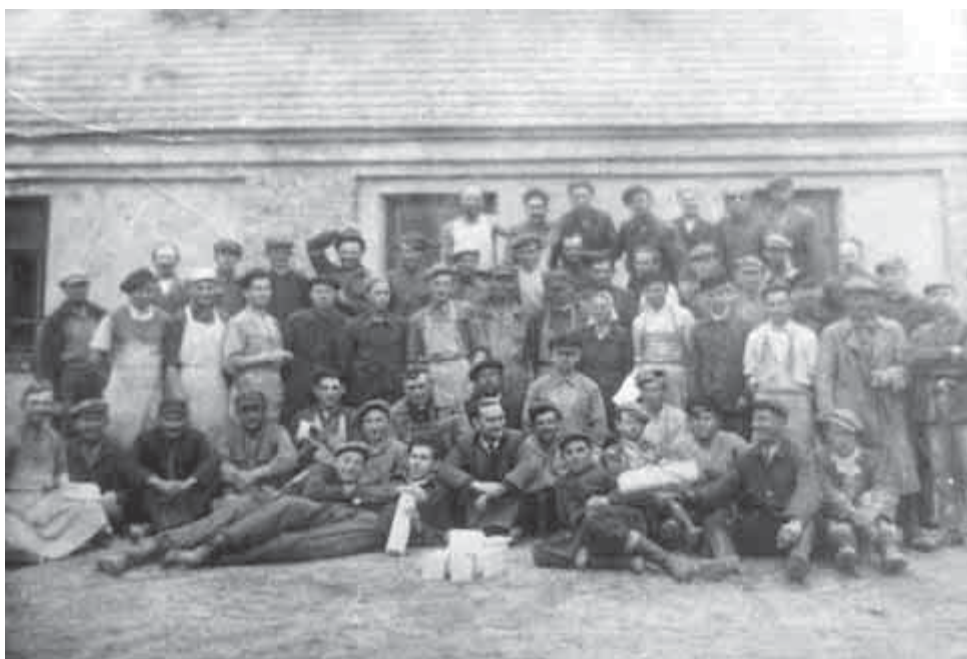
Персанал арлянскай кафлярні ў 1949 годзе

Драўніну для печы, дзе выпальвалі кафлю, зносілі навакольныя жы-