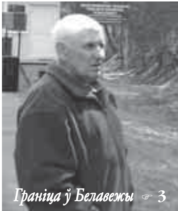
Граніца ў Белавежы 3