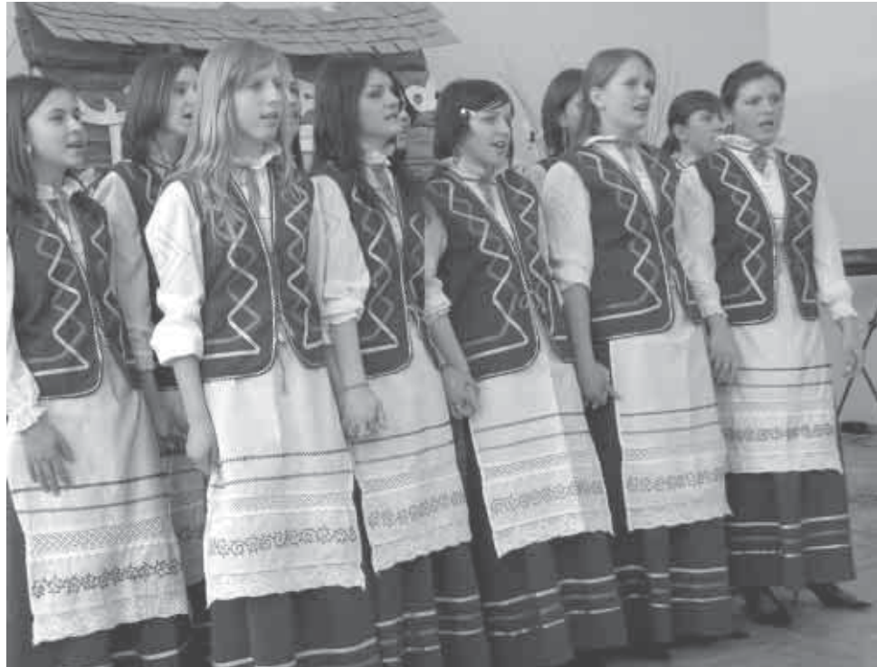
Калектыў „Калінка” з Залук