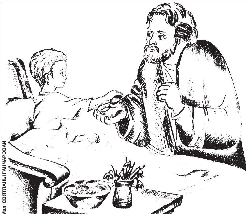
Мал. СВЯТЫЯНЫ ГАНЧАРОВАЙ

У пасхальную ноч бацькі хворага пайшлі на ўсяночную службу памаліцца, а хлопчык застаўся ў хаце адзін. Недзе апоўначы рыпнулі дзверы і ў пакой ува-