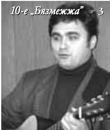
10-е „Бязмежжа“ 3