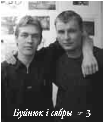
Буйнюк і сябры 3