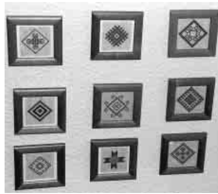
Аб’екты ў ПШ н-р 4 у Беластоку