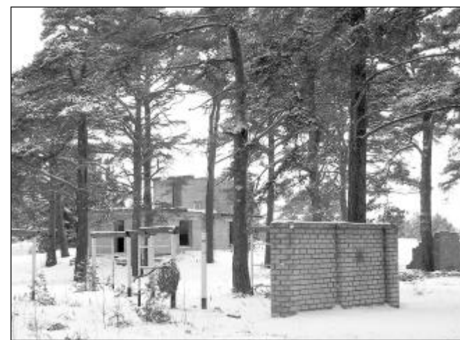
Pähklimännik Pärispeal mere ääres.

Ta selgitas, kui Pähklimänniku varemed ja rajatist lammutada, ei ole vallal enam millelegi teenindusmaad määrata ja sinna jääb ainult riigimaa. Sel juhul