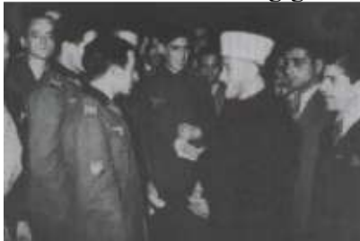
Muslimische und SS-Truppen mit Mufti.