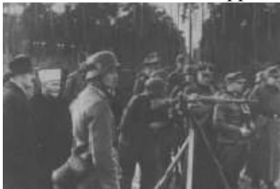
Der Mufti bei Schießübungen von SS-Truppen

(Mohammad) empören und sich bestreben, nur Verderben auf der Erde anzurichten, wird sein, daß sie getötet oder gekreuzigt oder ihnen die Hände und Füße an den entgegengesetzten Seiten abgehauen oder daß sie aus dem Lande verjagt werden.":