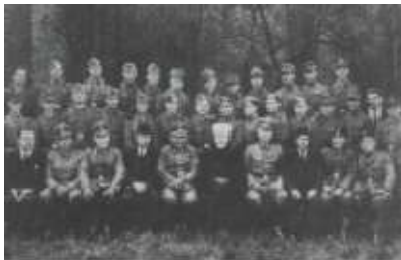
Der Mufti und hochrangige SS-Führer

Zusammen mit Hitlers Waffen-SS kämpften muslimische Truppen unter dem Großmufti von Jerusalem auf dem Balkan, um Juden und Zigeuner auszurotten. Dazu stellt der Mufti Hitler eine ganze Division zur Verfügung. Aus Gründen der "politischen Korrektheit" sind solche Bilder in der Wehrmachtsausstellung nicht zu finden: