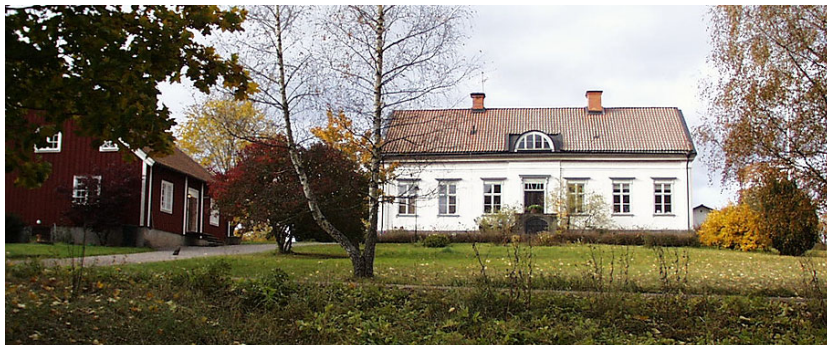
Herrsäter år 2002.