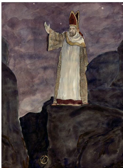
Biskopen kastar sin ring.

Hans Brask befann sig i Rom när han år 1501 blev utnämnd till domprost i Linköping. Tre år senare återvände Brask till hemlandet och 1513 invigdes han till biskop i Linköpings stift. I den positionen intog Brask en självskriven plats som medlem i rikets råd och kom snart att nå en politisk, ekonomisk och kulturell maktposition. Han hade stora framgångar som affärsman inom sitt stift, sökte ständigt utöka sitt gårdsinnehav och lär med tiden ha ägt närmare 600 gårdar. Vid reformationstidens ingång anses biskopsstolen i Linköping ha överträffat alla andra kyrkliga ämbeten i landet i fråga om ekonomiska tillgångar.