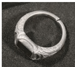
”Biskopens återfunna ring”.

Det har skrivits och sagts att det var biskop Brask som orsakade att koppargruvorna i Åtvidabergstrakten lämnades öde. Och visst kan det läggas honom mycket till last, men detta kan man väl ändå inte beskylla den egensinnige biskopen för - eller?