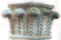
Chapiteau à palmettes