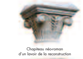
Chapiteau néo-roman d'un lavoir de la reconstruction