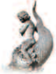
Enfant armé d'un trident chevauchant un dauphin

Utilisée abondamment dans les murs des lavoirs, les seuils et les encadrements des portes et des fenêtres, les corniches, les bacs de lavage, de rinçage, les pavements et dallages, les pierres de battage, les bancs d'égouttage... c'est surtout dans l'ornementation que la pierre d'Euville, de Savonnières, de Brauvilliers, de Lérrouville, a été exaltée grâce aux architectes talentueux qui confièrent aux sculpteurs la décoration de leurs oeuvres. L'activité des sculpteurs nous transporte dans l'Olympe du culte de l'eau où l'on voit défiler une série considérable de sujets mythologiques. Bestiaire et flore aquatique, divinités marines, naïades, gueules et têtes barbues, monstres grimaçants, cariatides, atlantes, dauphins, enfants potelés et joufflus chevauchant un monstre marin, tritons, cygnes... mêlés aux doucines, cavets, modillons et autres chapiteaux doriques, ioniques ou corinthiens ; tous ces éléments cherchent à exprimer par leur netteté, la volonté de l'artiste qui entend être l'interprète des grandes pensées de son temps : puissance et durée.