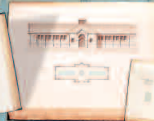
Planche B - élévation principale et plan général.