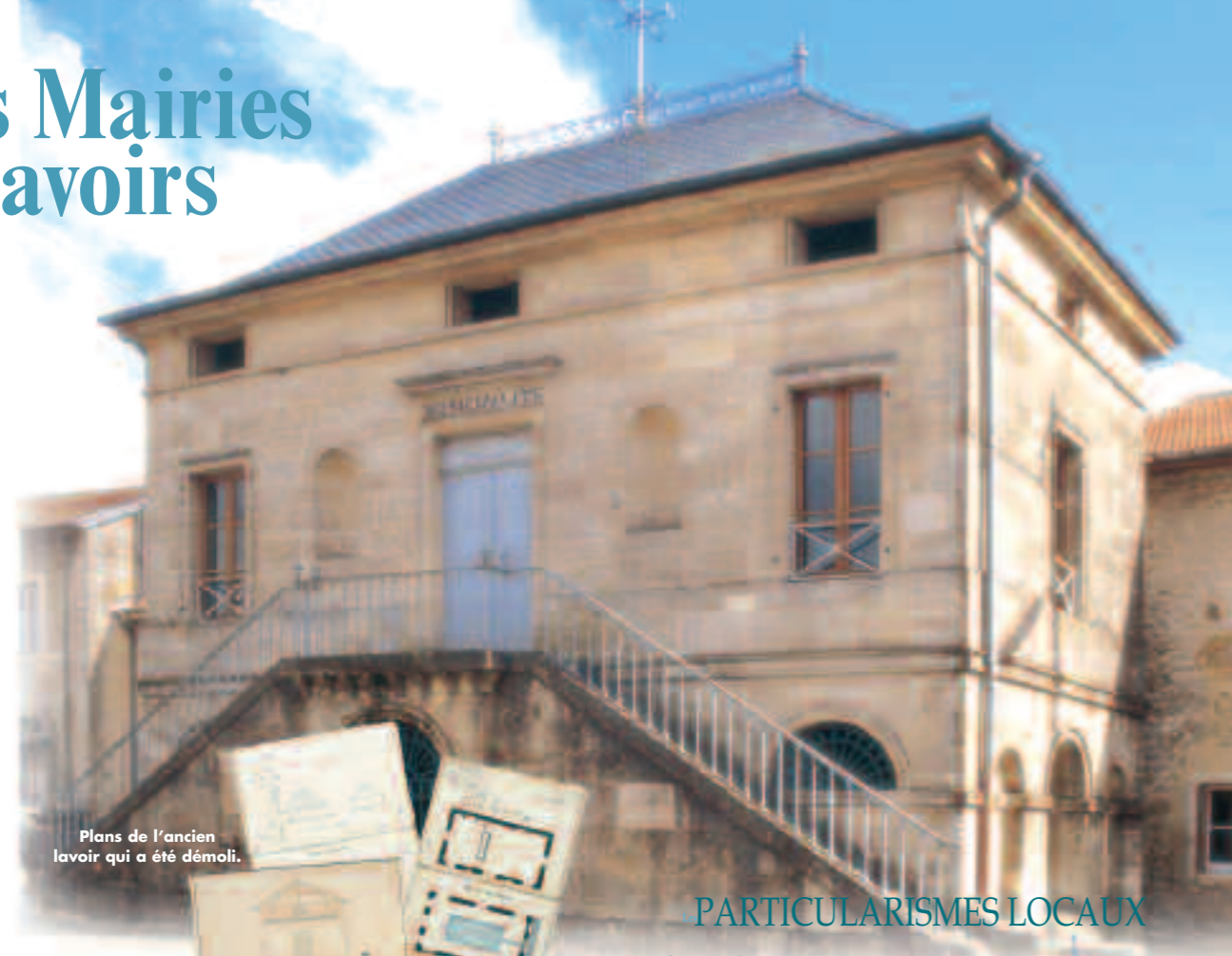
Plans de l'ancien lavoir qui a été démolì.