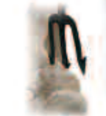
Trident terrassant le monstre marin