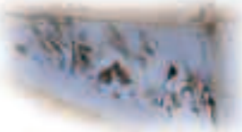
Divinité marine adossée à une urne déversant l'élément liquide

La pierre a pris une part importante dans la construction et le décor des fontaines et des lavoirs. Elle est incontestablement le matériau naturel le plus présent en Meuse qui a légué des oeuvres artistiques remarquables.