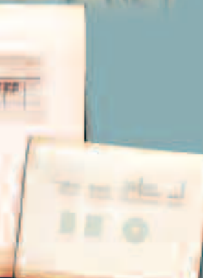
Planche C - coupe longitudinale et vue en plan du bac de rinçage et des deux bassins de lavage.

Eugène Viollet-le-Duc, Inspecteur Général du Service des Monuments Historiques fit en 1868 une déclaration, à propos du sous-équipement des campagnes françaises en matière d'édifices publics : «Il est très beau d'élever dans de grandes villes des monuments qui restent comme le sceau imprimé par la richesse et la splendeur d'un pays ; mais quand, à côté de ces centres de population, on ne trouve plus, en parcourant les cités de troisième ordre, les simples communes, que des édifices publics insuffisants, mal disposés, mal bâtis, et d'un goût équivoque ou prétentieux, il est permis d'admettre que l'état de civilisation de la contrée est, ou peu avancé, ou en pleine décadence.