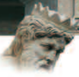
Tête de Neptune