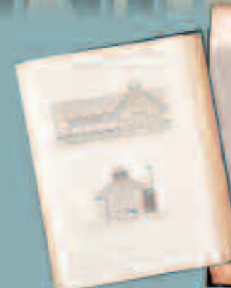
Planche A - coupes longitudinale et transversale de l'édifice.