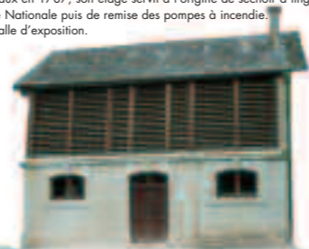
Lavoir-séchoir de Montiers-sur-Saulx Ce bâtiment a été édifié en 1847, c'est l'un des rares édifices de ce type construit en Meuse. Restauré en 1994, il sert aujourd'hui de bâtiment d'accueil pour le camping municipal.