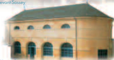
Lavoir d'Ancerville Construit sur deux niveaux en 1787, son étage servit à l'origine de séchoir à linge, de local pour la Garde Nationale puis de remise des pompes à incendie. Aujourd'hui il sert de salle d'exposition.

Les Mairies-Lavoirs symbolisent la répartition sexuée des rôles : à l'étage, le bureau des édiles, des hommes qui débattent des affaires publiques et communautaires ; au rez-de-chaussée celui des femmes, des «mauvaises langues» ou des «poules d'eau», qui s'occupent des affaires privées, domestiques voire intimes.