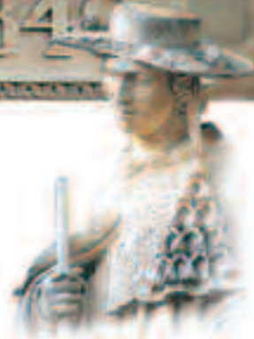
Détail de la fontaine du Bienheureux Pierre de Luxembourg