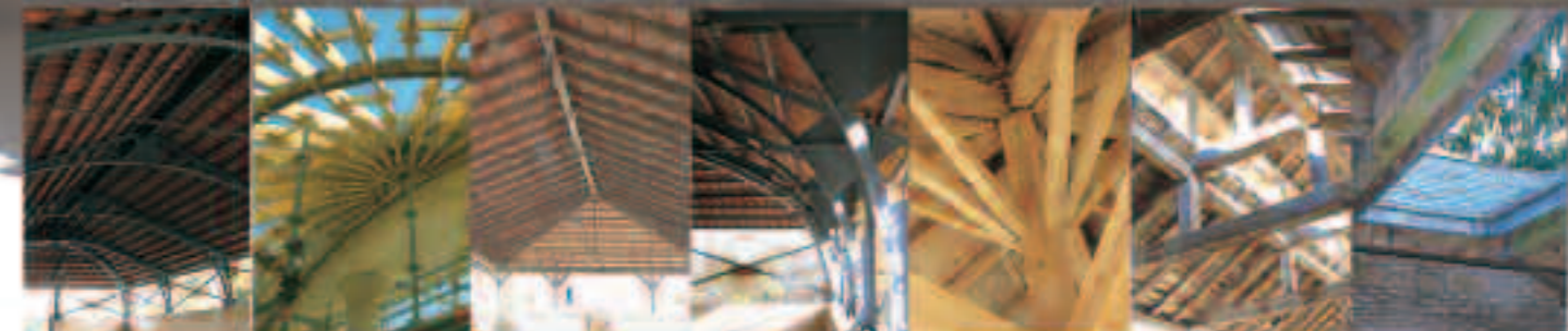
Billy-sous-Côtes - charpente métallique cintrée

L'étude et la réalisation des charpentes ont joué un rôle capital dans le développement des nouvelles techniques constructives initiées par les ingénieurs des Arts et Manufactures. A ce titre, les petits édifices publics ruraux construits durant la première moitié du XIXe siècle ont servi de laboratoire d'étude et de mise en application des procédés issus de la technologie industrielle naissante en Lorraine.