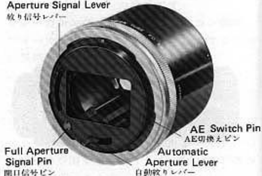
Full Aperture Signal Pin 開口信号ピン