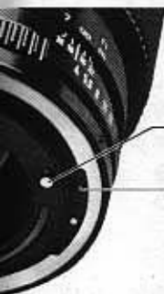
Reserved Pin 予備信号ピン

A Eカメラで絞りリングをAマーク位置にセットして使用する場合、カメラ側からの信号を受けて適正絞り値をきめるストッパーとなります。Aマーク位置にないときは、絞りリングと1対1で動き、追針測光カメラを含め