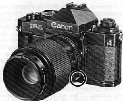
Aperture Signal Lever 絞り信号レバー