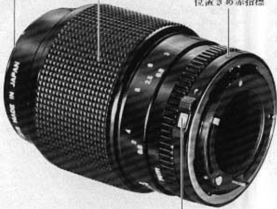
Extension Tube FD 50-U エクステンションチューブFD50-U