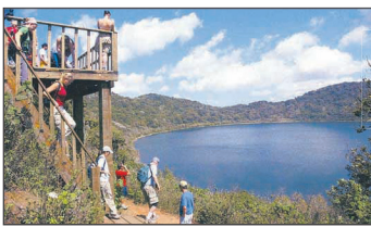
Laguna de Ipala que se encuentra en el cráter del volcán con el mismo nombre.

CHIQUIMULA: Por tratarse de la cabecera departamental en esa ciudad se concentra el comercio, bancos, instituciones y centros educativos que la convierten en un lugar atractivo. Su fiesta titular se celebra del 12 al 18 de agosto, en honor a la Virgen del Tránsito.