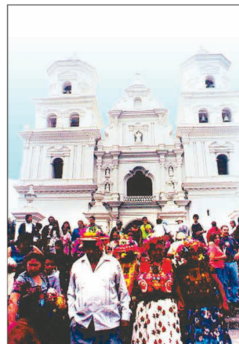
La Basílica de Esquipulas alberga la imagen del Cristo Negro, lugar que se ha convertido en un centro de peregrinación internacional.

ESQUIPULAS: Entre 1560 y 1570 se fundó la villa de Esquipulas, actualmente municipio, lugar que fue elegido para la veneración del Cristo Negro, y que ha convertido a esta población fronteriza con Honduras y El Salvador en la capital de la fe católica centroamericana.