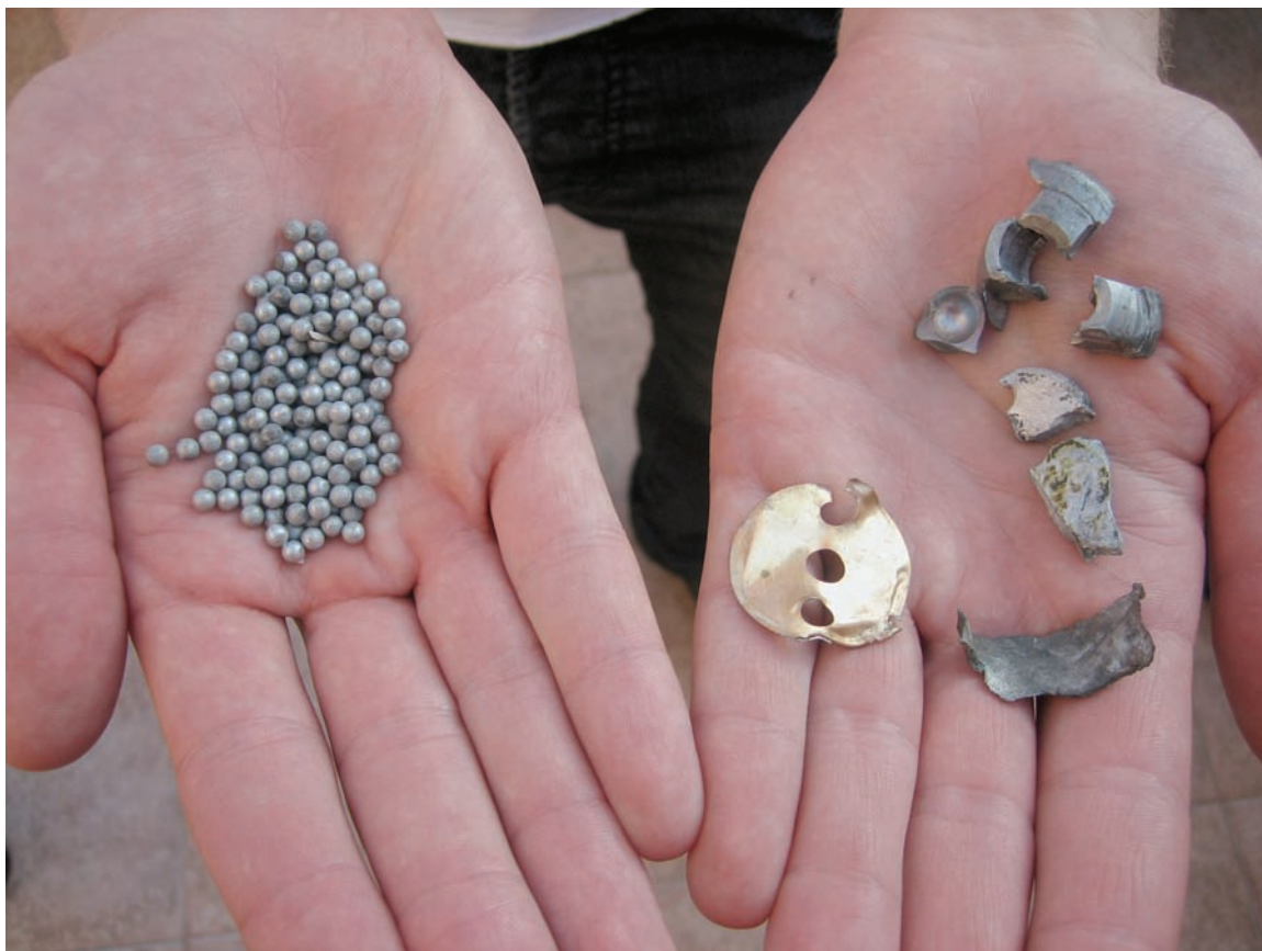
גבר אוזחז בפייסות תחמושת מצרר מסוג MZD-2 שלדבריו נחתו בהצרו שבכפר מר'אר ב-25 ביולי 2006. בצד שמאל ניתן לראות גולות פלדה בקוטר 3 מ"מ מסוגן של הגולות שפצעו שלושה מבני משפחתו. בצד ימין ניתן לראות חתיכות מחלקה העליון של תחמושת-משנה כזאת.

תחמושת המשנה מסוג MZD-2 קלה לזיהוי. פריטיה דומים בצורתם לפעמונים גליליים עם סרט באחד הקצוות. רצועת פלסטיק המלאה בגולות מתכת בקוטר 3 מ"מ כרוכה במאוזן סביב מרכז הגליל. בפנים ישנו "מטען חלול" חודר-שריון. גולות המתכת שהרקטות הרגילות של חיזבאללה בקוטר 122 מ"מ ובקוטר 220 מ"מ נושאות, כלומר הרקטות שאינן מכילות תחמושת-משנה, הן בקוטר של 6 מ"מ.