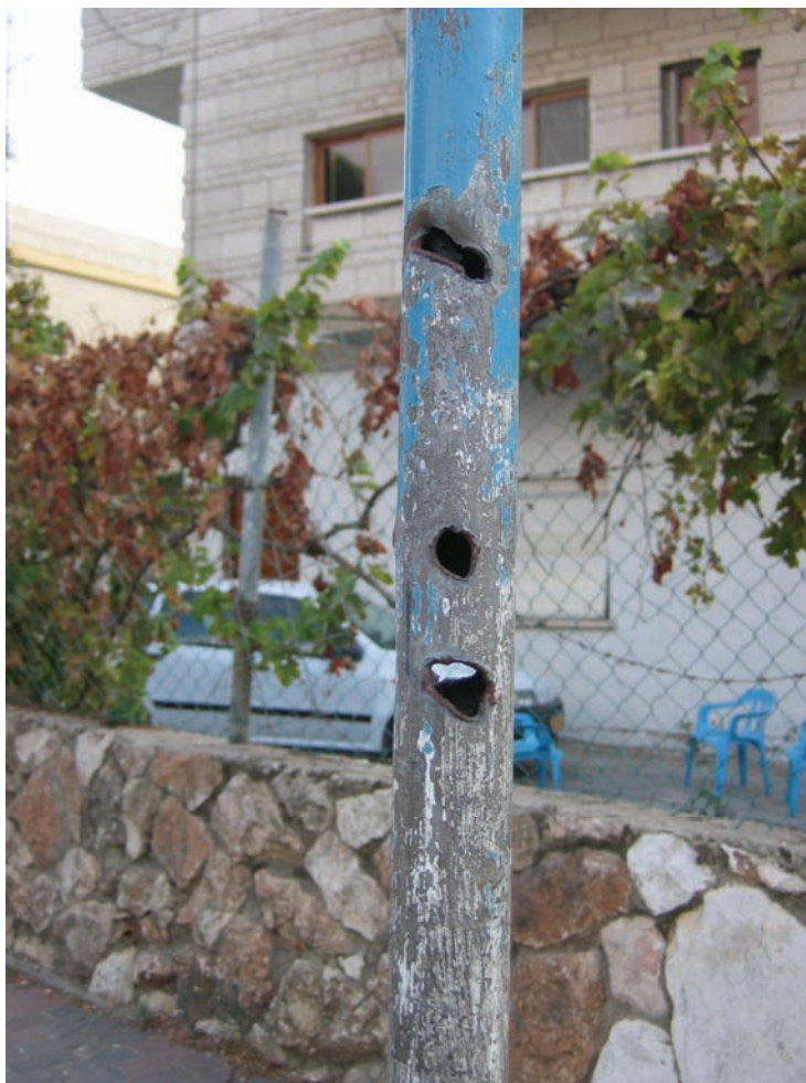
עמוד במג'ד אל-כרום שחדרו אליו גולות פלדה ורסיסים מרקטה שפגעה ברחוב בקרבת מקום ב-4 באוגוסט 2006; מפגיעת הרקטה נהרגו שני גברים.

כשנשאל על מטרות צבאיות אפשריות ציין אסדי פתחי כי ישראל הציבה תותח ארטילריה על פסגת הר חלוץ, כשני קילומטרים מצפון-מזרח לדיר אל-אסד, וכי מסוללה זו בוצע במהלך המלחמה ירי בלתי פוסק לשטח לבנון. הוא שיער כי ייתכן שהרקטות שנחתו על בית משפחתו החטיאו את תותח הארטילריה, שהיה יעדן המקורי. לדבריו, "אנחנו פשוט אזרחים במדינת ישראל. מה שקורה לאחרים קורה גם לנו". 154