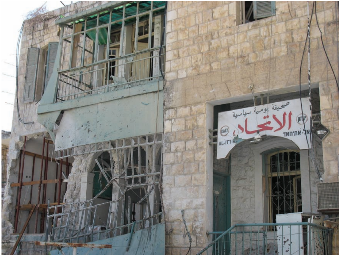
בניין שבו נמצא ארכיון העיתון אל-איתחאד בשכונת ואדי ניסנאס בחיפה לאחר פגיעת רקטה ב-6 באוגוסט 2006; מפגיעת הרקטה נהרגו שני קשישים בבניין הסמוך.

גם אם אכן כיוון חיזבאללה, במשך חלק מן הזמן, את התקפותיו על אובייקטים צבאיים או על מתקני תעשייה בחיפה, הרי שהארגון לא הביע כל צער על כך שאזרחים נהרגו כתוצאה מהתקפותיו. זאת, עד ה-6 באוגוסט, אז פגעו הרקטות שלו בשכונת ואדי ניסנאס המאוכלסת ברובה בערבים. בהתקפה נהרגו שני תושבים ותושב שלישי נפצע קשה. רק אז עלה מזכ"ל חיזבאללה חסן נסראללה לשידור בטלוויזיה והפציר בתושבים ערבים לעזוב את העיר (ראו להלן פרק אודות "הצדקות חיזבאללה להתקפות על אזורים אזרחיים").