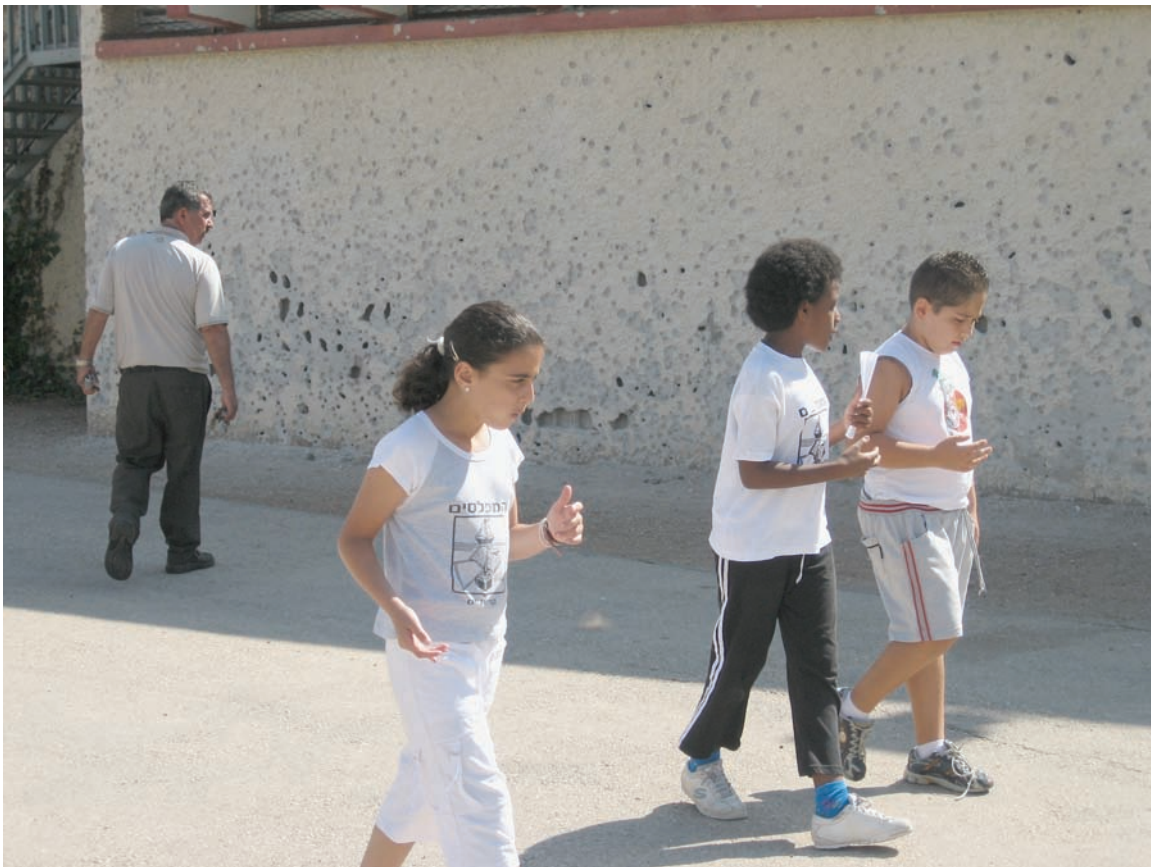
קיר בבית הספר היסודי "המפלסים" בקריית ים, שניזוק מפגיעת גולת פלדה שניתזו מרקטה אשר פגעה בכיתה סמוכה ב-13 באוגוסט 2006, © 2006 בוני דוקרטי / ארגון Human Rights Watch

התקפות חיזבאללה על מתחם רפאל אין בהן כדי להסביר את הפיזור הנרחב וחסרת ההבחנה של נחיתת הרקטות ברחבי קריית ים. למיטב ידיעתנו, בעיר לא נמצאו שום מטרות צבאיות משמעותיות אחרות במהלך המלחמה. תפרוסת התקפות הרקטות ברחבי העיר, ששטחה חמישה קמ"ר, בהנחה שתצלומי האוויר של העיר המוצגים באתר העירייה מייצגים אותה נכונה, אינה מותירה ספק רב באשר לשאלה האם חיזבאללה ירה ללא הבחנה, אפילו אם אכן קיווה לפגוע במתחם רפאל.