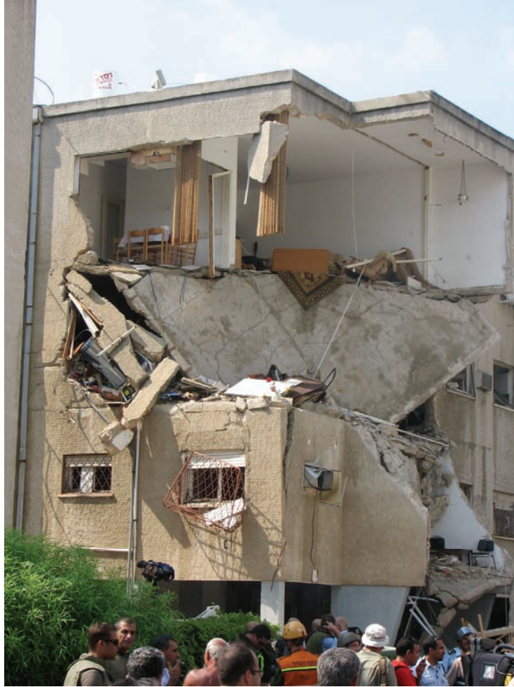
ב-17 ביולי 2006 פגעה רקטה בבית דירות זה, הנמצא בשכונת בת גלים בחיפה; שישה דיירים נפצעו.

מפקד משטרת חיפה גורס כי חיזבאללה כיוון את התקפותיו בעיקר אל מטרות באזור הנמל וכי הרקטות המעטות יחסית שנחתו בעיר העילית החטיאו את מטרותן. הבעיה היא שבין אזור הנמל והשכונות העשירות יותר בעיר העילית ישנן שכונות המגורים הנמוכות יותר, אשר חלקן מאוכלסות בצפיפות. לכן, אם אכן ניסה חיזבאללה לפגוע באובייקטים באזור החוף, הרי שלרקטות הבלתי-מדויקות שלו, שעפו מרחק של שלושים קילומטרים, היה סיכוי גבוה לפגוע בשכונות מגורים ובאזורי מסחר סמוכים, ואמנם כך היה.