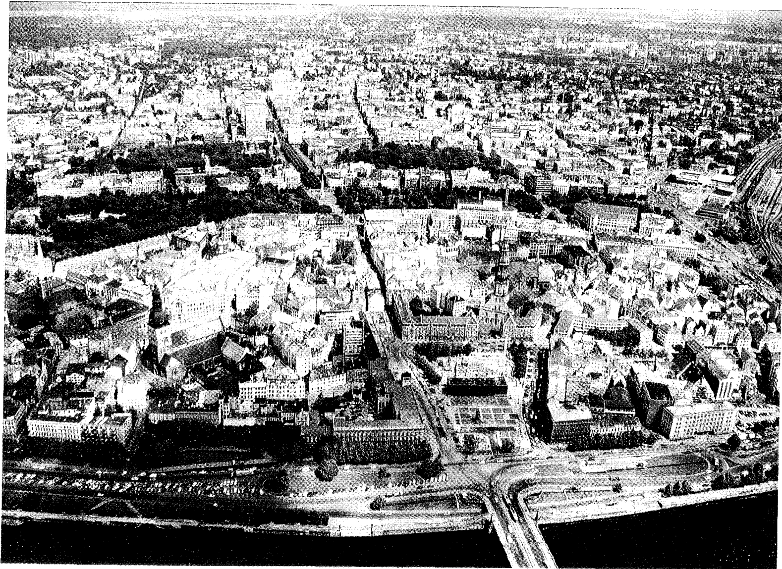
Riga : Vue aérienne du Centre-ville / Aerial view of city centre