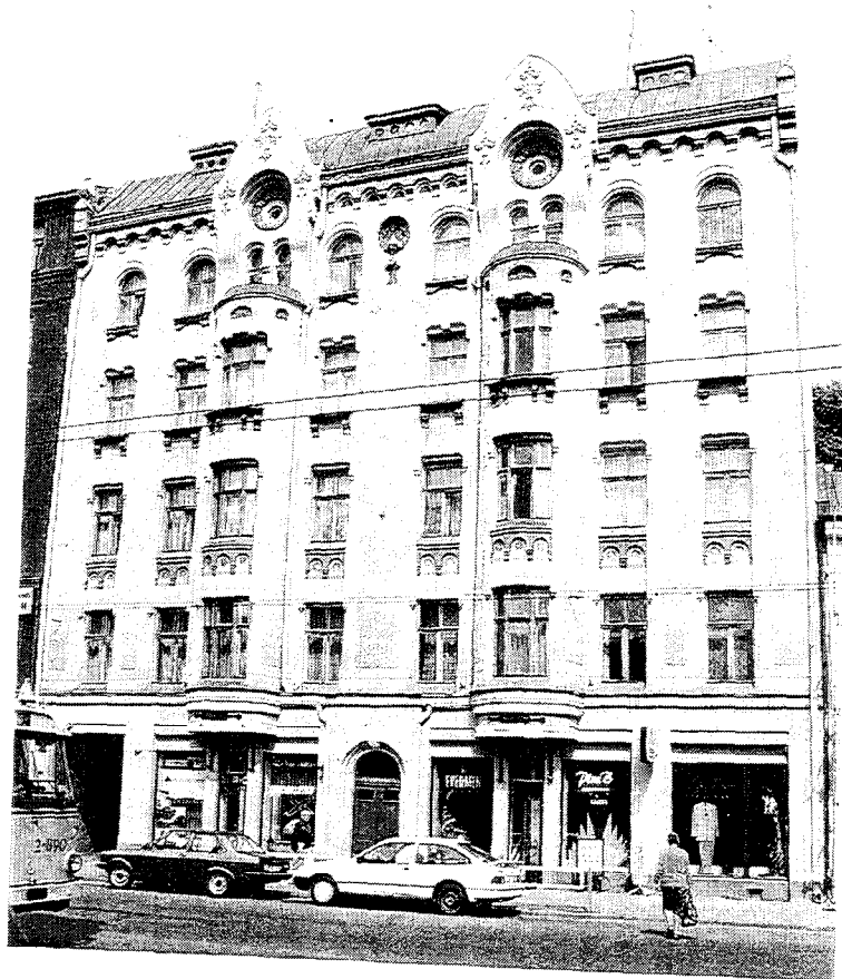
Riga : Édifice Jugendstil de la rue Brivibas / Jugendstil building in Brivibas Street