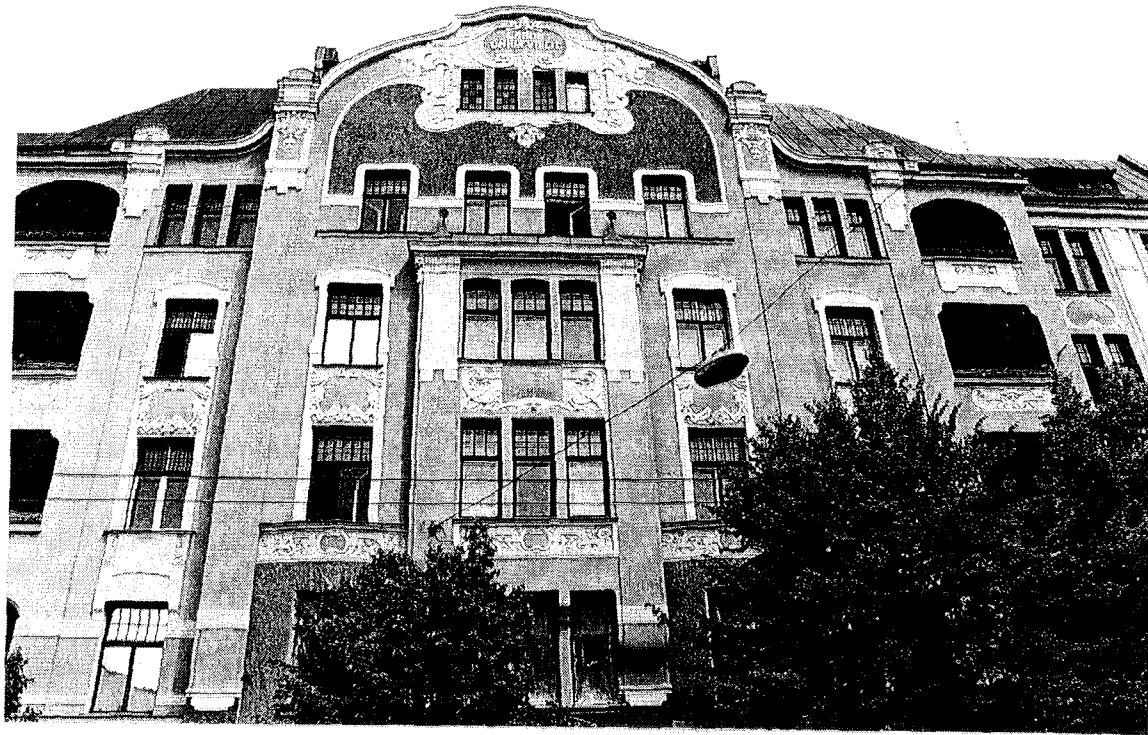
Riga : Bâtiment en bois du 19ème siècle / 19th century wooden building