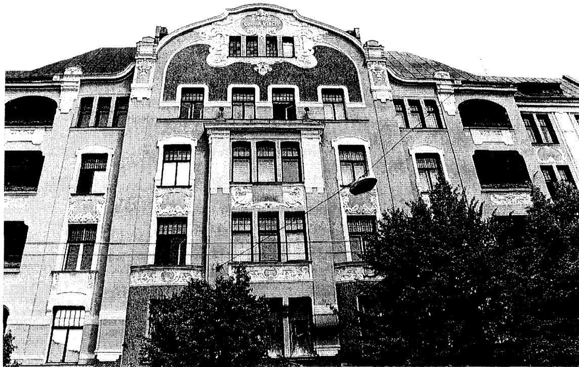
Riga : Bâtiment en bois du 19ème siècle / 19th century wooden building