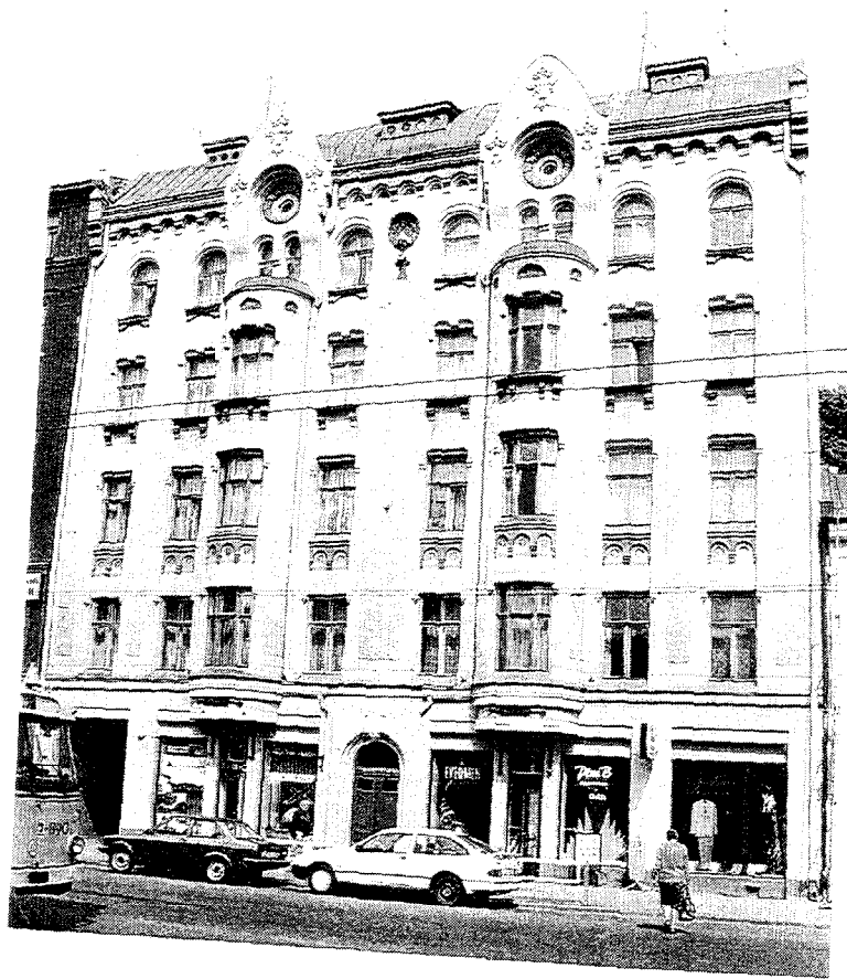
Riga : Édifice Jugendstill de la rue Brivibas / Jugendstil building in Brivibas Street