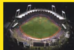
プエルトリコ/サンファン ヒラム・ビソン・スタジアム