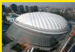
日本/東京 東京ドーム