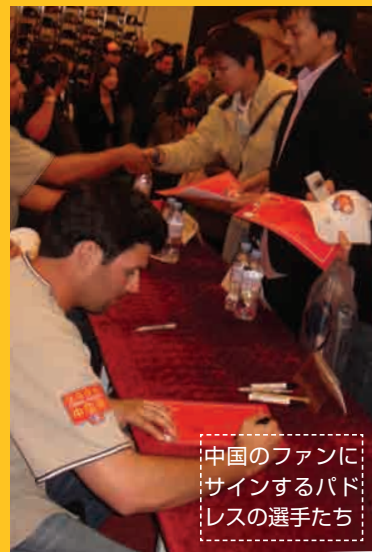
中国のファンにサインするパドレスの選手たち

3 月 13 日 (木) には、サンディエゴ・パドレスの選手による 1 時間のサイン会が開かれ、ヒース・ベル、ジャスティン・ジャーマン、ケビン・クーズマノフ、トレバー・ホフマンの 4 選手がポスター、キャップ、T シャツなどにサインしました。メディアも巻き込んだこのイベントでは 4 選手がファンに挨拶したり話しかけたりする場面もあり、ファンは、間近に MLB 選手と接することができて大感激。サインをもらったあるファンはインタビューに対し「選手たちはすごく優しく、中国語で話しかけてくれた」と応えていました。