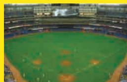
カナダ/トロント ロジャース・センター