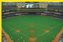
Toronto, Canadá Rogers Centre