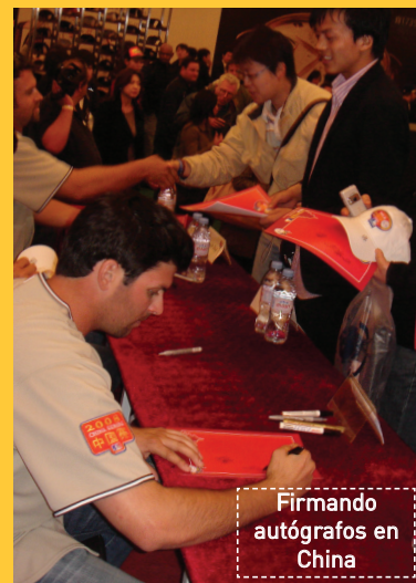
Firmando autógrafos en China