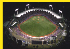
San Juan, Puerto Rico Estadio Hiram Bithorn