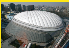
Tokio, Japón Tokyo Dome