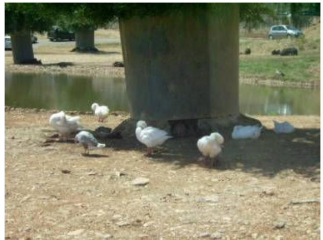
Gyalogséta során kattintott video- és fényképek: