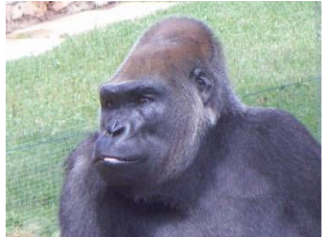
Egy-két felvétel az Állatszínházi attrakcióról: