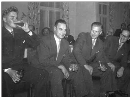
Oluenjuontakilpailut Hotelli Otavassa 26.9.1953, ekonomit vastaan tuomarit. Kuvassa ekonomien joukkue.

Yhteistyö eri järjestöjen kanssa oli niin kiinteää, että Porin Seudun Ekonomit lähetti vuosittain mm. Porin Teknilliselle Seuralle ja Satakunnan lakimiesyhdistykselle toimintakertomuksen kohteliaan kirjeen kera, jossa kiitet-