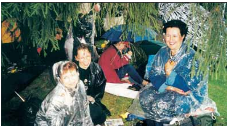
Sää ei aina suosi jazz-eillakaan, mutta tunnelmaa ei pieni sade haittaa.