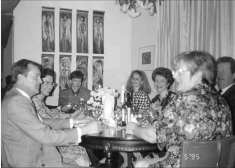
Flooran päivänä vierailtiin yhdessä Rauman Ekonomien kanssa Turussa 12.5.1995. Enkelitalossa nautittiin talon herkkuja ”taivaallisissa” tunnelmissa. Kuvassa porilaisia, raumalaisia ja turkulaisia ekonomieja saman pöydän äärellä.

nut on järjestänyt ohjelman. Väliin toukokuinen Flooran päivä on sattunut huonolle viikonpäivälle ja tapahtuma on vietetty sopivampana ajankohtana.