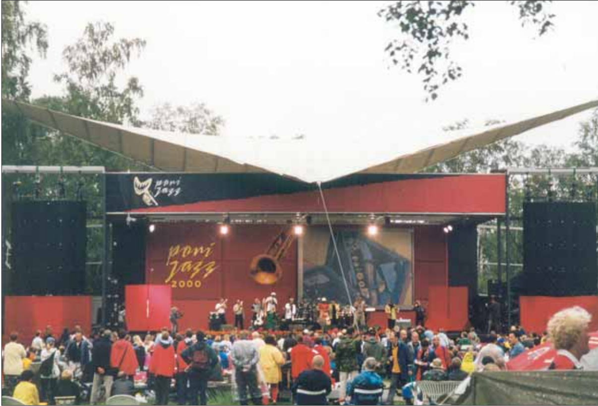
Jazzit 2000 ja Buena Vista vetivät yleisöä sateesta huolimatta.