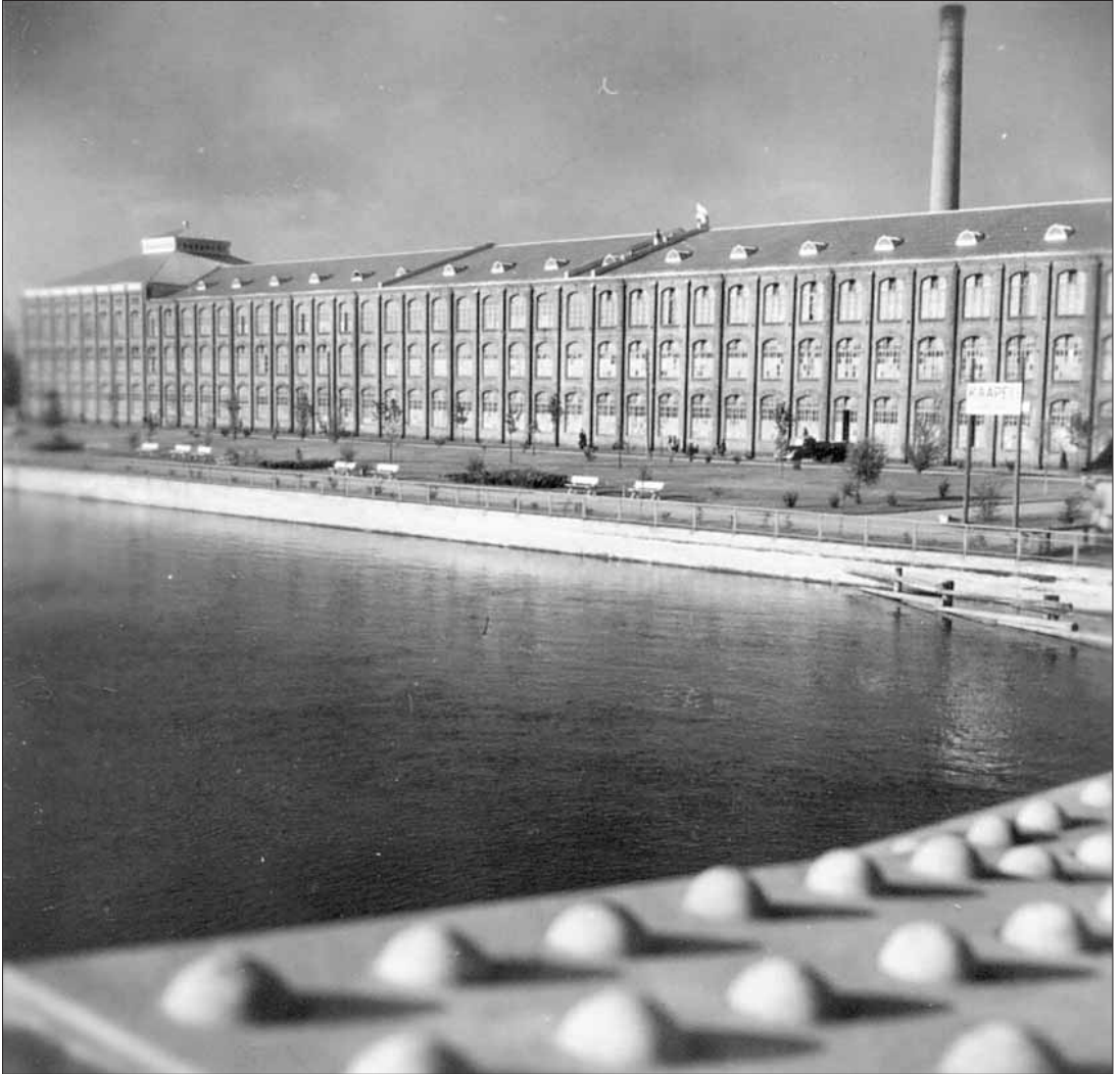
Puuvillatehdas Porin sillalta kuvattuna paluumatkalla tehdasvierailulta 30.9.1954. Puut oli juuri istutettu.

tui niiden asioiden kokemus, koulutus, organisaatio ja suhteet. Kaiken lisäksi asioilla oli kiire, sillä Akava, Korkeakouluinsinöörien ja Arkkitehtien Keskusliitto ja Insinööriliitto olivat jo vuonna 1973 aloittaneet toimenpiteet, joilla työsopimusmenettely saataisiin myös yksityisen sektorin ylempien toimihenkilöiden osalta työmarkkinajärjestöjen sopimusten piiriin. Suomen Työnantajien Keskusliitonkin kanssa asiasta oli jo keskusteltu, mutta sopimuksia ei vielä oltu tehty.