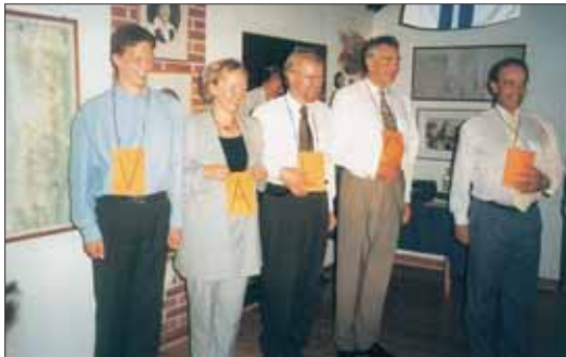
Teknillisen Seuran tekniikka riitti siihen, että sana saatiin valmiiksi.