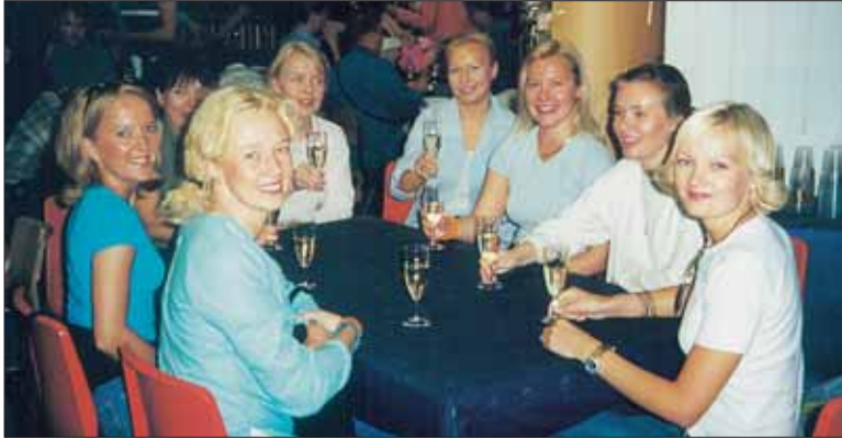
Iloisia Jazz 2000-ilmeitä.