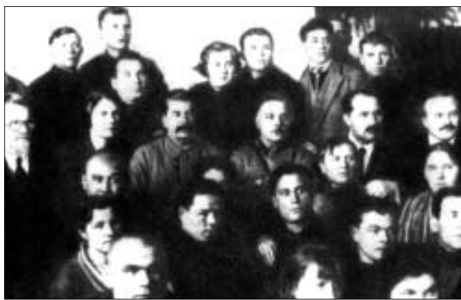
В узком кругу «вождя и учителя» понимали почти без слов. Слева от Сталина М.И. Калинин, справа – К.Е. Ворошилов, Л.М. Каганович, В.М. Молотов.

<126> Товарищ Сталин: Все, что тут у вас написано правильно (речь идет о письме бюро ячейки к т. Сталину), только не все сказано. В критической части можно гораздо больше сказать. Оценка тут у вас дана правильная, только мягкая, недостаточная.