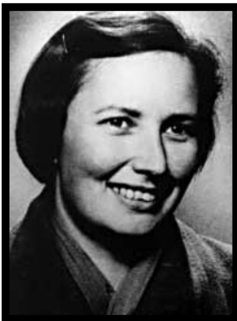
Такой мы её запомним