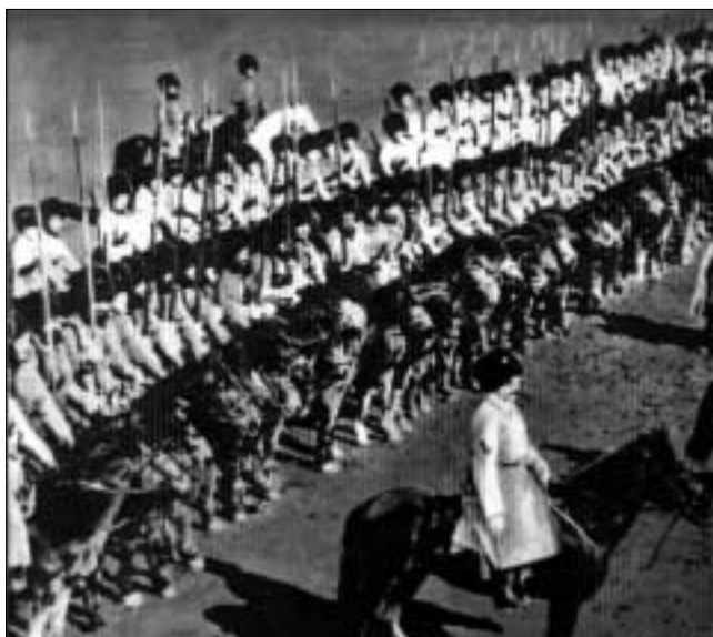
Уральские казаки перед атакой. 1919 г. (Частная коллекция).