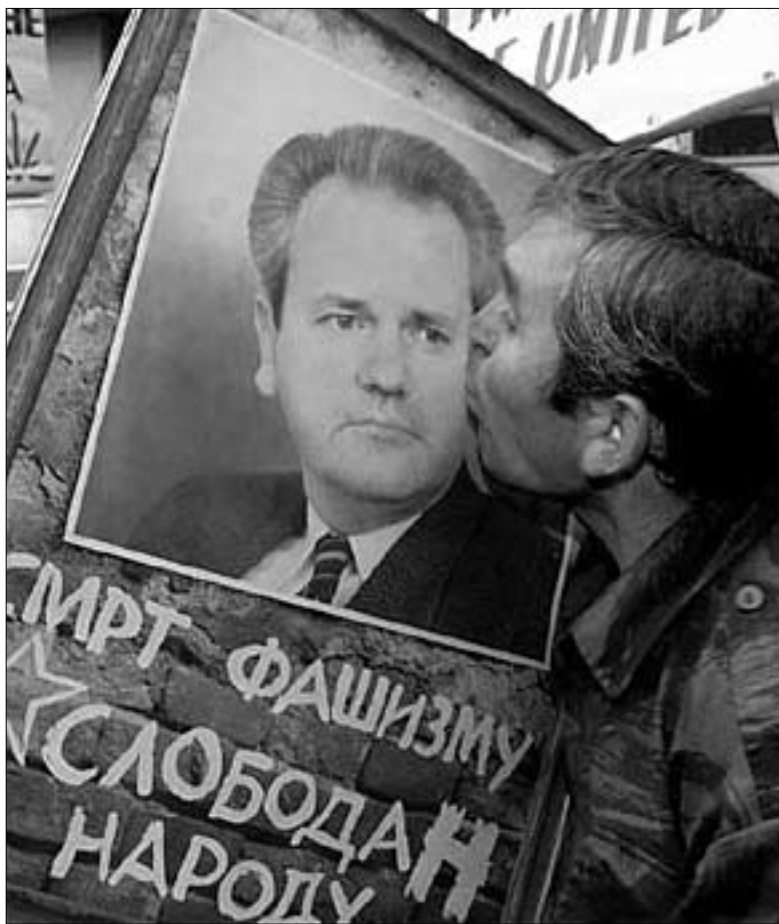
Идолы и поклонники

И здесь Милошевич снова неплохо помог Западу. Министр иностранных дел России Иванов, выступая в думе через несколько дней после начала натовских бомбардировок Югославии, говорил следующее: «Когда в октябре 1998 года Россия предотвратила бомбардировки НАТО Югославии, убедив Белград согласить-