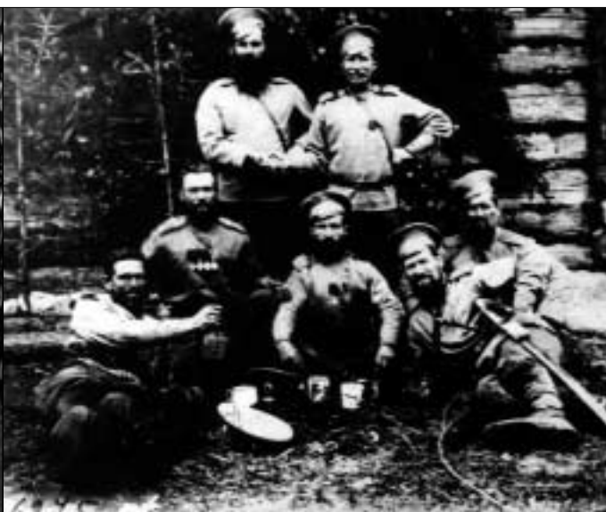
Группа казаков Уральской армии. 1919 г. (Государственный центральный музей современной истории России).

рии с рядом других советских «героев». Сегодня настало время окончательно с помощью документов развенчать этот миф.