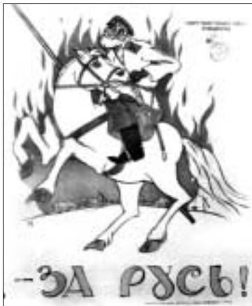
Плакат Уральского казачьего войска. 1919 г.

Из-за волжских гор зеленых На Яицкий городок Большевицские громады Потянулись на восток. Много есть у них снарядов, Много пушек и мортир, И ведет их, подбоченясь, Сам Чапаев – командир. Хочет он Яик мятежный Покорить, забрать в полон, И горят, чадят станицы, И народный льется стон... Почитай, во всех поселках Казни, пьянство и грабеж И гуторят меж собою