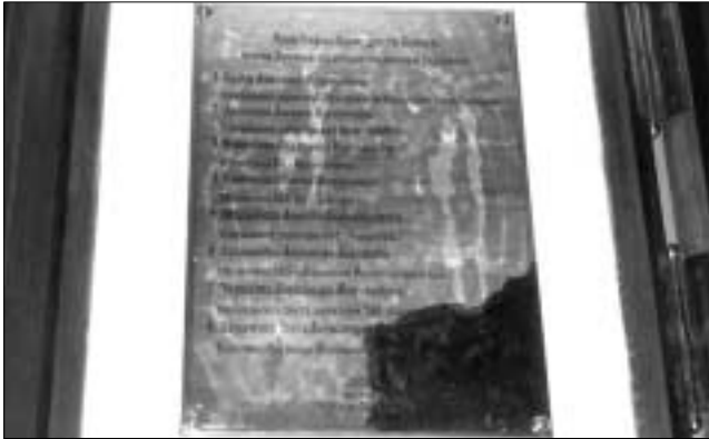
Так бы жертвовали на каждый храм...