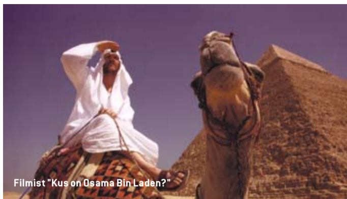
Filmist „Kus on Osama Bin Laden?”