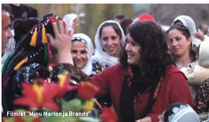
Filmist "Minu Marlon ja Brando"

Varasematel aastakümnetel on Türgi film teinud läbi väga drastilisi arenguid. 1960ndatest kuni 1970ndate keskpaigani oli Türgi filmitootmise ajaloo mõju-