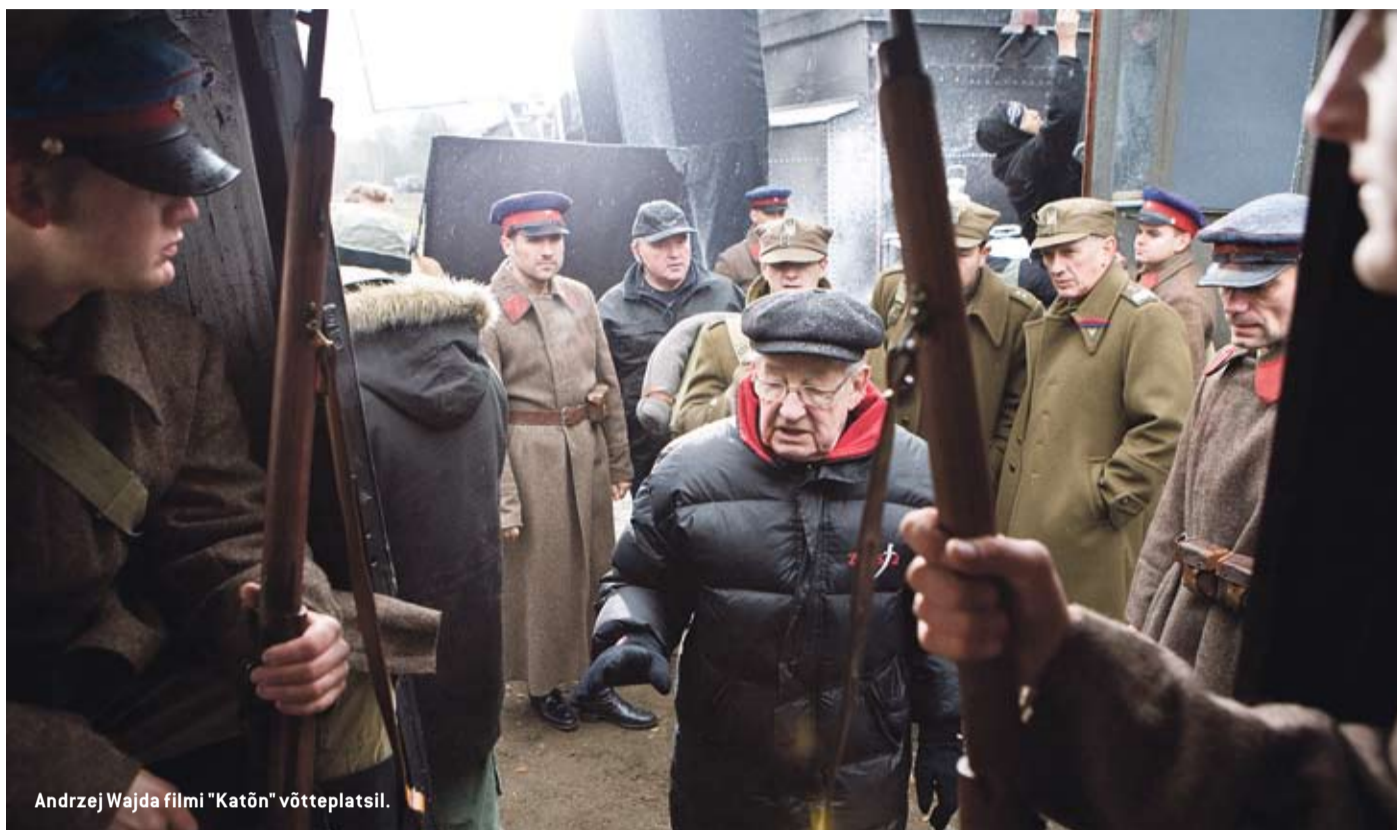
Andrzej Wajda filmi "Katõn" võtteplatsil.

Kuid mida meie tahtsime? Me tahtsime ainult seda vabaduse ja tennsuuri vahelist piiri natuke nihutada, et saaksime teha niisuguseid filme nagu "Tuhk ja teemant". Tookord ei mõelnud me sellele, et kunagi elame ajani, mil Nõukogude Liit kokku variseb ja Poola jälle vabaks saab. Arvasime, et kõik, mida teha saab, ongi vaid nende piiride edasi nihutamine, et partei ise ei juhiks, vaid lubaks enda kõrval kõlada ka mingil osal selle ühiskonna häältest, mille üle ta valitseb. Kui tahetakse osaleda sellise ühiskonna elus, mis ei ole meie jaoks soovitud tegelikult ega loodud meile tahte järgi, vaid võõra võimu poolt ajaloolise