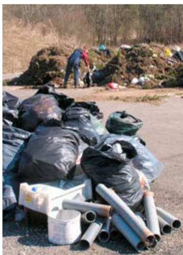
Kalmistud sorteerivad prügi