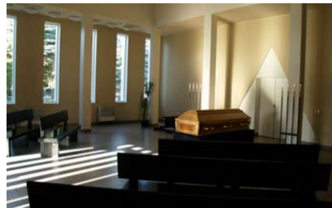
Tartu krematooriumi kabel