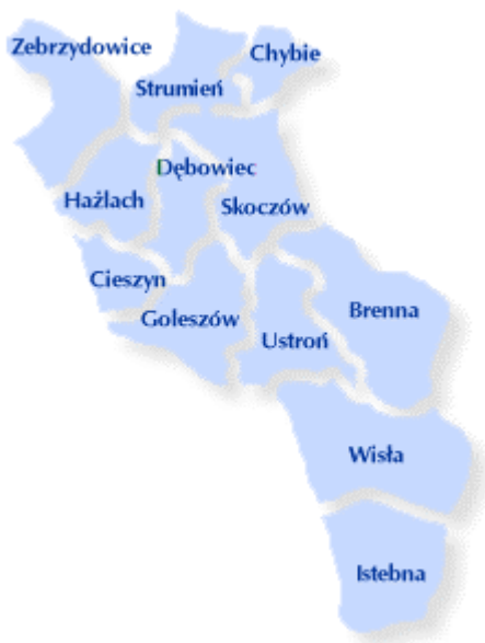
Mapa nr 4 – Gminy powiatu cieszyńskiego

Turystyka w powiecie cieszyńskim stanowi jedną z ważniejszych dziedzin gospodarki, będąc istotnym i wiodącym źródłem dochodów i tym samym miejscem zatrudnienia wielu mieszkańców. Ponadto w dziedzinie przemysłu dominują: przemysł chemiczny, elektromaszynowy, spożywczy. Ważną rolę odgrywa również handel i usługi.