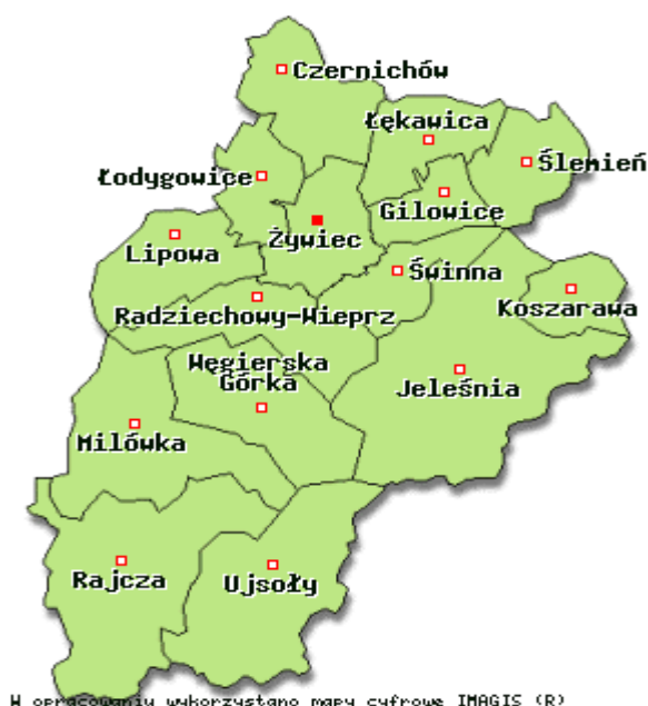
Mapa nr 3 – Gminy powiatu żywieckiego

Potencjał gospodarczy powiatu żywieckiego jest zróżnicowany. Największe przedsiębiorstwa usytuowane są w Żywcu np. „Grupa Żywiec”, „PONAR” Żywiec (fabryka maszyn i urządzeń), „FAMED” S.A. – Fabryka sprzętu szpitalnego, „HUTCHINSON” Sp. z o.o. Na terenie całego powiatu dobrze rozwija się drobna wytwórczość, rzemiosło, usługi oraz handel. Poza wielkimi pracodawcami, najwięcej miejsc pracy zwłaszcza sezonowo tworzonych jest w branży turystycznej. Dla tak rozległego powiatu o dużym potencjale turystycznym ma to bardzo istotne znaczenie w aspekcie gospodarczym i społecznym.