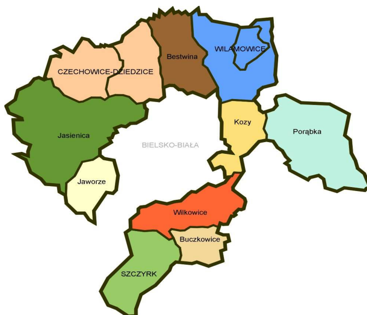
Mapa nr 2 – Gminy powiatu bielskiego

Obszar powiatu bielskiego wynosi 457 km 2 co stanowi 3,7 % powierzchni województwa śląskiego. Liczba ludności powiatu wynosi ok. 150 tys. mieszkańców czyli 3,2 % ludności województwa. Do obszaru o najwyższej koncentracji ludności należą Czechowice – Dziejdzice oraz Jasienica, najsłabiej zaludnione gminy to Jaworze i Szczyrk. Strukturę administracyjną powiatu tworzy 10 gmin, w tym: 1 gmina miejska, 2 gminy miejsko-wiejskie oraz 7 gmin wiejskich. Powiat bielski należy do grupy powiatów ziemskich „owiniętych” wokół miast na prawach powiatów (powiatów grodzkich).