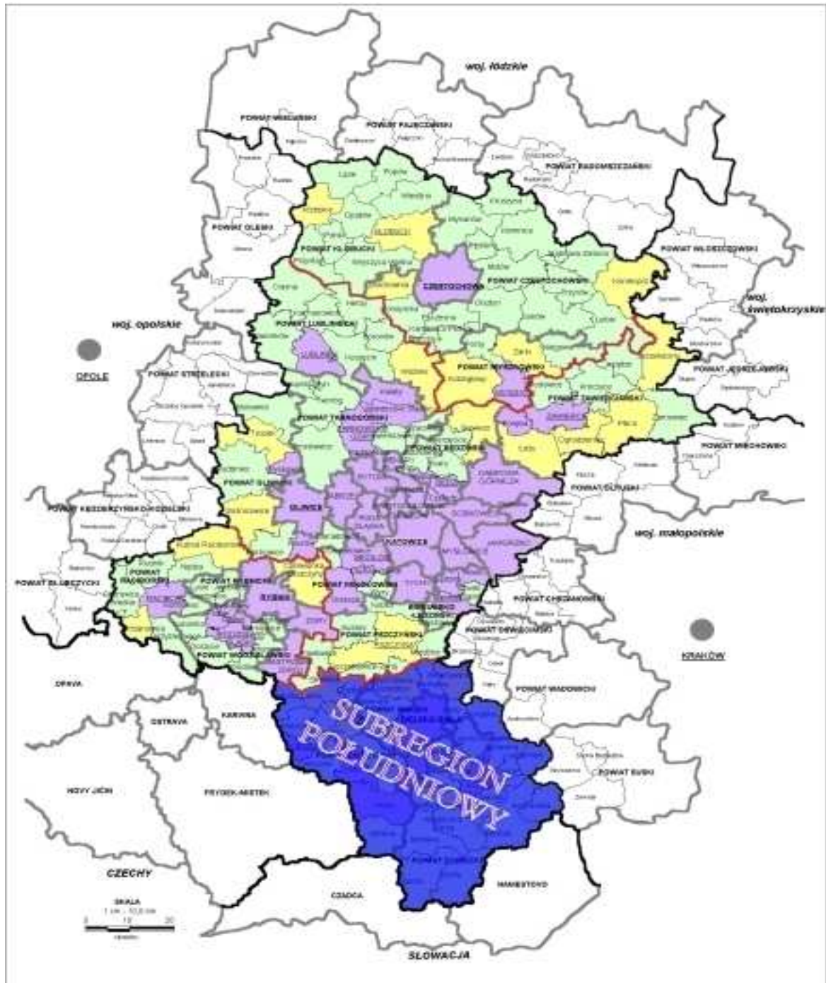
Mapa nr 1 – Subregion południowy na tle województwa śląskiego

Subregion południowy województwa śląskiego zajmuje obszar 2 352 km 2 , co stanowi ok. 19 % powierzchni województwa. Zamieszkiwany jest przez 647 522 mieszkańców (13,8% ogółu ludności województwa). Obszar ten zorganizowany jest wokół aglomeracji bielskiej, która z innymi miastami obszaru (Cieszyn, Czechowice – Dziedzice, Żywiec, Skoczów, Ustroń, Szczyrk i Wiśla) powiązana jest międzyregionalną i regionalną siecią transportową.